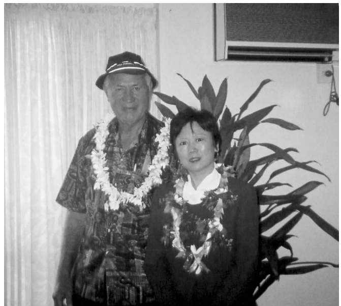
库克群岛副总理特拉派莫阿特会见李小林副会长