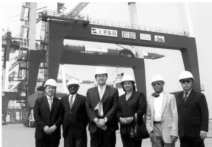
佛得角客人参观上海振东集装箱码头

表示，中国政府免除佛得角到期债务，继续给佛以援助，佛政府对此表示衷心感谢，这对于佛顺利实现转型必将发挥重要作用。□