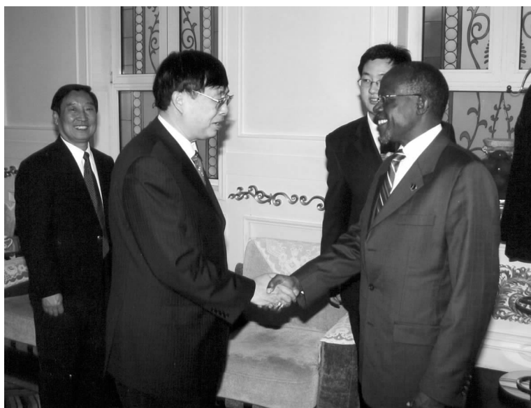
陈昊苏会长与肯尼亚地方政府部部长科姆博亲切握手

代表团前往广州东湖街道办事处，了解其在社区服务、居民服务方面的工作。代表团赞赏地方基层机构在法律咨询、工商业管理、组织社区活动等方面提供的全方位服务。在参观该区一个街头广场时，科姆博部长还饶有兴趣地和晨练的居民们打起了乒乓球。□