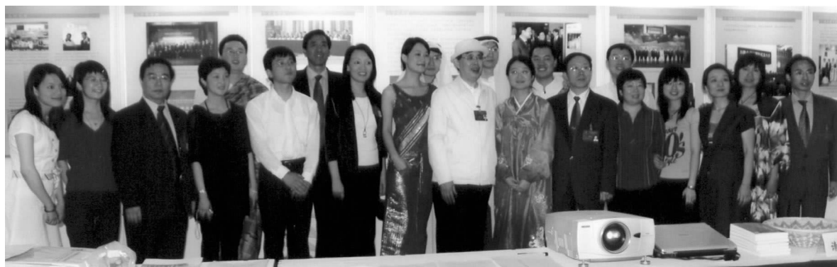
部分与会理事参观亚非工作部对外交流成果展区

胡锦涛总书记在中央外事工作会议上的讲话强调外交工作要统筹国内国际两个大局。我会所开展的民间外交工作是总体外交的组成部分之一，理所当然要为总体外交、祖国发展和世界和平这三个大局服务。为三个大局服务应该注意贯彻民间外