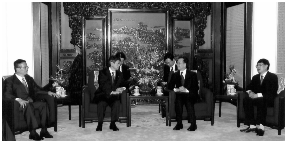
温家宝总理会见高村正彦会长率领的日本日中友好议员联盟代表团

4月28日至5月2日,高村正彦会长率领日本日中友好议员联盟代表团访问了北京和大连。4月28日,温家宝总理在北京会见了代表团。温总理表示,他4月访日成功是中日两国政府和人民共同努力的结果。中日友好符合时代潮流和人民愿望,是大势所趋,