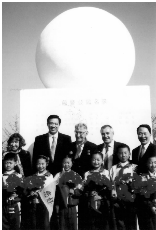
1996 年 5 月，大连市市长薄熙来授予阿尔希波夫“荣誉市民”称号

1984 年率苏联政府代表团访华时与中方签署了一系列协议，成为 80 年代中苏经贸合作的良好开端。现在中俄经贸合作保持着良好的发展势头，已进入到新的历史阶段，但当年签署的协议至今还有现实意义。两国在核电站、热电站等大型工业项目上的合作都包含着阿尔希波夫所作的贡献。