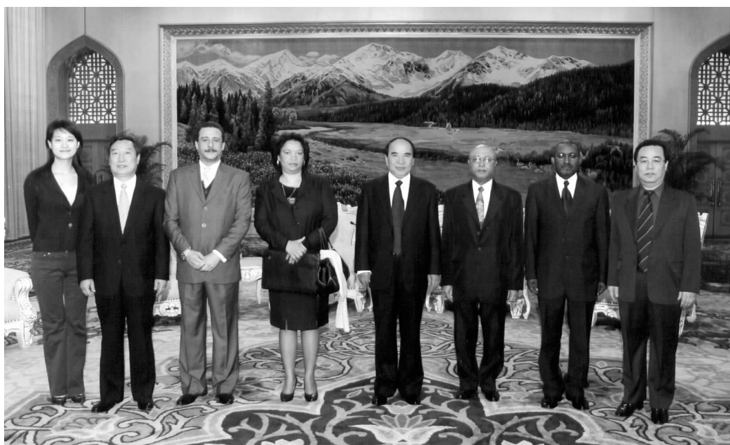
全国政协副主席阿不来提·阿不都热西提会见代表团

代表团表示,佛得角政府高度赞赏中国政府倡导的建立和平、和谐世界的外交理念,愿意与中国携手共建这一理想社会。在台湾问题上,代表团再次重申,佛得角始终坚持一个中国的政策,从未动摇,也永远不会动摇。三位秘书长感谢中国政府长期以来