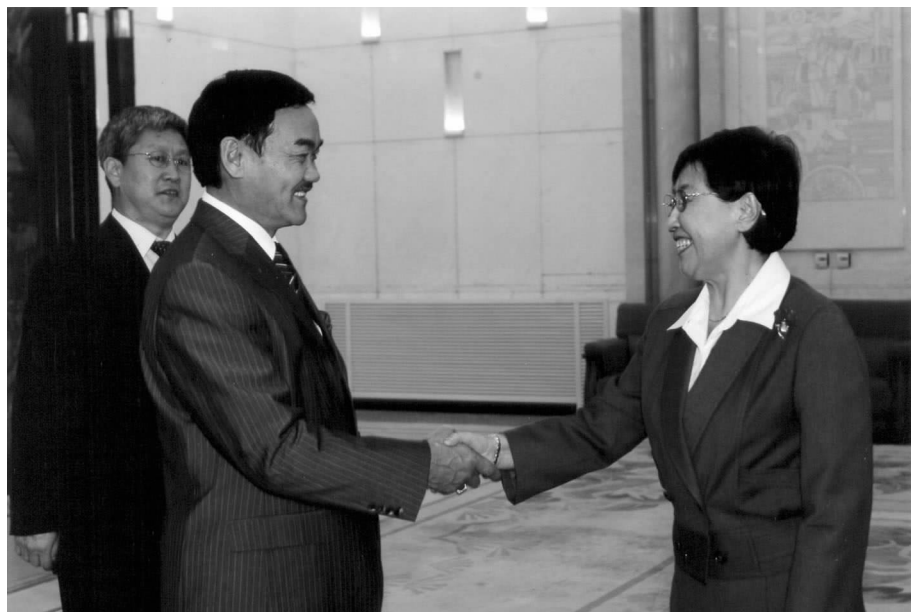
全国人大常委会副 委员长乌云其木格 会见巴嘎班迪