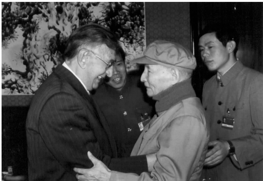
1989年10月1日,陈云会见阿尔希波夫

日,对外友协、中俄友协在钓鱼台国宾馆举行隆重仪式,授予阿尔希波夫“人民友好使者”荣誉称号,以此祝贺他89岁寿辰。1997年5月,在阿尔希波夫九十华诞之际,对外友协将陈昊苏会长主编、高莽同志撰写的《阿尔希波夫的故事》一书赠送给他和他的家人,借此表达中国人民对他美好的祝愿。阿尔希波夫充满深情地说:中国是我的第二故乡,我的心有一半留在了中国。陈昊苏会长和中俄友协其他领导访俄期间多次专程去阿尔希波夫家看望他和他的夫人。陈昊苏会长说:阿尔希波夫和叶卡捷林娜老妈妈把中国朋友当作自己的亲人,其真挚情谊令所有到过他们家的中国同志终生难忘。阿尔希