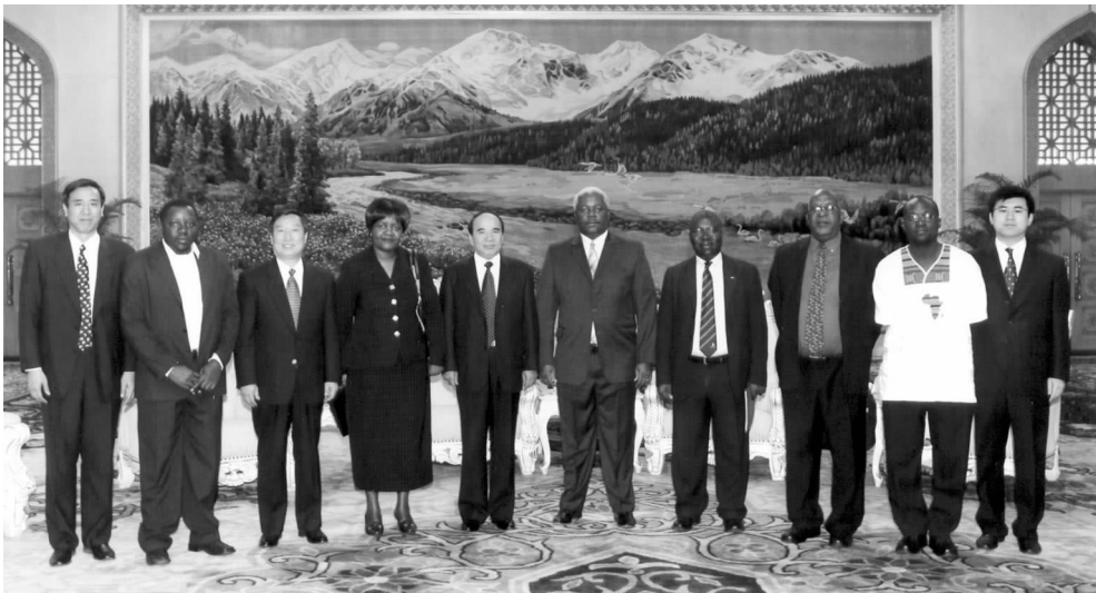
全国政协副主席阿不来提·阿不都热西提会见津巴布韦地方政府代表团

在阿不来提·阿不都热西提副主席会见代表团时，乔姆波部长表示，津巴布韦非常高兴看到中国的崛起。他表示，中国的崛起能够给广大第三世界国家带来帮助。中国在津巴布韦独立过程中就给予无私的援助；建交后，两国关系稳定友好，双方领导人多次互访，经贸往来日益增多。两国在联合国等国际组织中始终密切配合，像兄弟一样站在一起。面对来自西方国家的制裁，穆加贝总统坚决领导津巴布韦人民反抗到底，坚持走自己的道路。乔姆波团长也代表津巴布韦政府感谢中国长期以来在经济、政治等方面对津巴布韦的支持。□