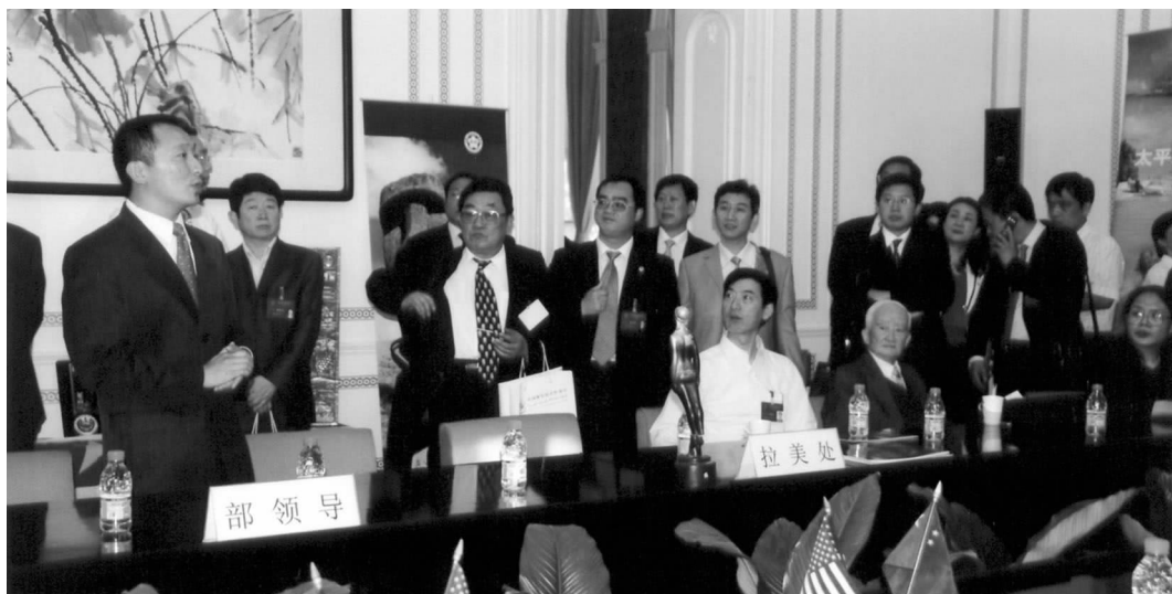
与会理事听取美大工作部开展对外交流合作工作汇报

我们已经建立了面向非洲、阿拉伯、拉美、大洋洲、东盟、欧盟等大区友协以及中朝、中韩、中蒙、中印、中巴、中以、中俄、中日、中美等国别友协，今后还要考虑建立面向中亚、南亚、东北亚的大区友协。要在已建和拟建的大区友协和国别友协中引入新的工作机制，特别注意打造有效的工作平台，积极建造开展交流活动的设施，开设能够涵盖全面合作的交流论坛，在这些努力的基础上开展有声有色的民间外交活动。三个拓展点是在多边和非政府组织交流的基础上，把经贸合作和文化交流也列为重要的拓展方向，也要注重打造新的工作平台、开辟新的交流阵地、引进新的工作机制。考虑借鉴一些单位的成功经验，成立企业家俱乐部和文化沙龙，促进经贸