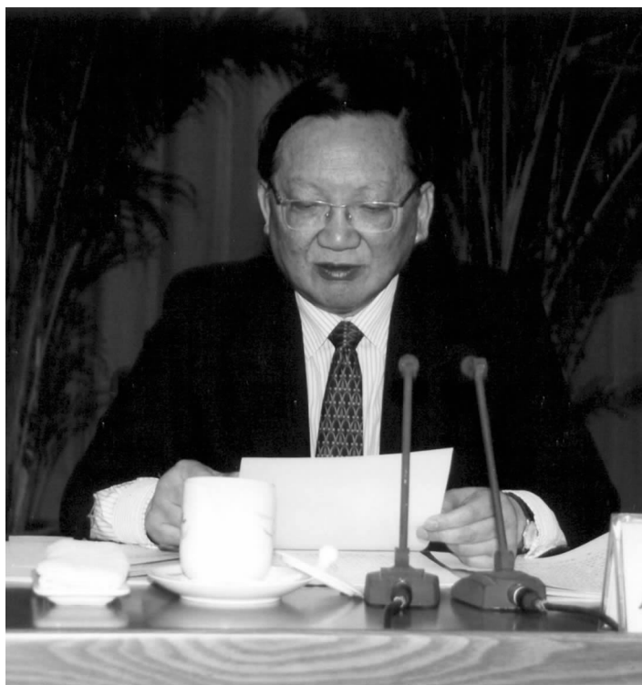
唐家璇国务委员在对外友协第九届全国理事会会议上讲话

唐家璇说,回顾新中国外交半个多世纪的历程,一条基本的经验和一个重要的特色,就是重视民间外交,坚持政府外交和民间外交同时并举的工作方针。在不同的历史时期,我国的民间外交为树立中国人民热爱和平、伸张正义、推动进步、谋求发展的国际形象,为争取和平稳定的国际环境,发挥了难以替代的重要作用。新中国成立初期,面对西方的外交孤立、经济封锁和军事包围,我们根据毛泽东主席关于要寄希望于人民的思想,广泛调集社会各界力量,积极开展对外民间交往,通过民间外交打破帝国主义封锁,沟通与各国人民的联系,促进国家关系演变,为新中国外交的奠基和发展开辟了道路。在此过程中,以民促官成为社会主义外交的一大创举。在改革开放的新时期,民间外交更以各国人民为对象,积极开展广交深交朋友的工作,宣传我国的和平外交政策,展现中国人民珍爱友谊、崇尚和平的形象。同时,大力弘扬中国优秀文化,广泛开展经济、文化、体育、科技等形式多样的交流,以长年不懈的努力为我国外交事业蓬勃发展巩固和加强了社会和民意基础。回顾过去可以看出,每当国际环境出现重大变化,每当我国对外关系遇到重大难题时,民间外交往往能以其独特的工作优势和灵活多样的工作方式,成为政府外交及时而重要的补充,发挥出积极的建设性作用。