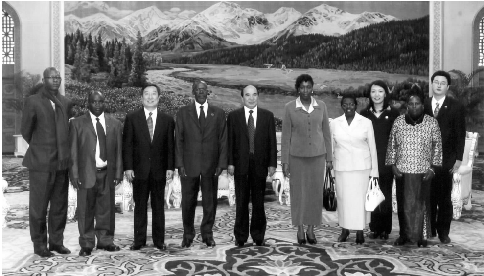
全国政协副主席阿不来提·阿不都热西提会见肯尼亚地方政府部代表团

方政府部的官员、韦伯耶等城市的市长或市政秘书长。他们渴望了解中国在城市规划、环境保护等方面的情况，学习相关的经验。通过拜会国务院发展研究中心北京国际城市和发展研究院，代表团了解了中国的区域经济发展政策，尤其是解决城市化进程中出现的问题的有关措施。科姆博部长认为中国对发展、尤其是城市建设是有