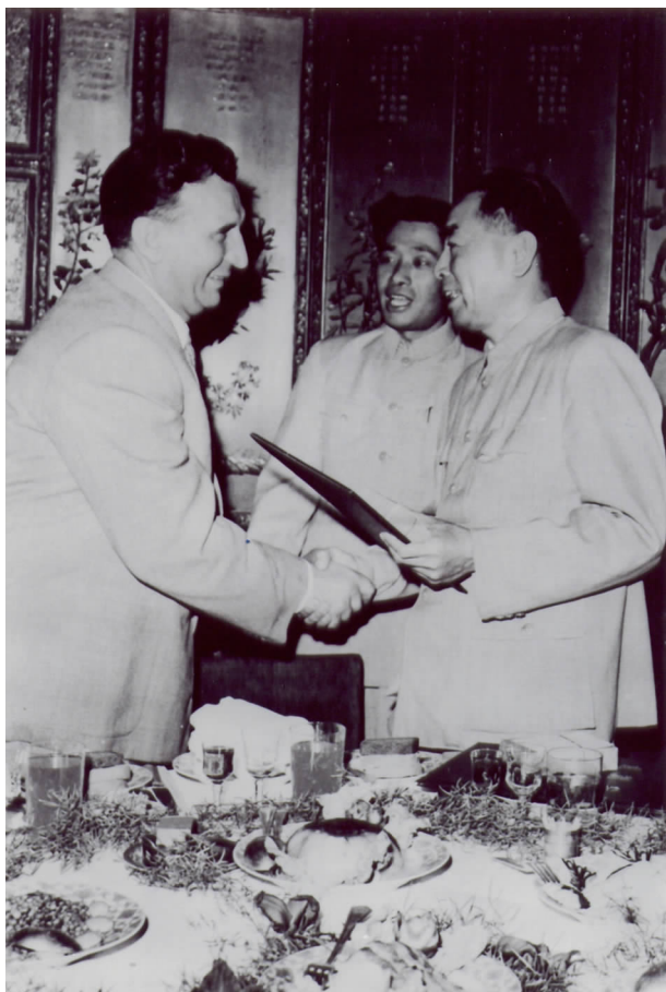
1958年周恩来总理向阿尔希波夫颁发感谢状

陈昊苏会长充满深情地介绍了中国人民的老朋友阿尔希波夫不平凡的一生，高度评价他对中国社会主义建设事业和俄中友