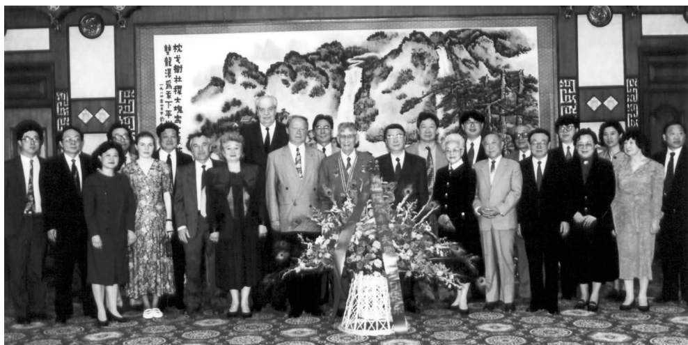
1996年5月1日,对外友协授予阿尔希波夫“人民友好使者”称号

薄熙来部长在讲话中指出,新中国成立后第一次大规模、高水平的对外经贸合作是从苏联援建的156个项目开始的,它的实施拉开了中国现代史上工业化的历程。阿尔希波夫当时作为中国政府的经济总顾问,为此投入了全部热情和精力。薄部长追述了上世纪50年代那激情燃烧岁月里他的父亲薄一波等领导人与阿尔希波夫同甘共苦、情同手足的动人故事,回忆他本人任大连市长时两次接待阿尔希波夫,并于1996年5月授予他“大连荣誉市民”光荣称号的情景。薄部长