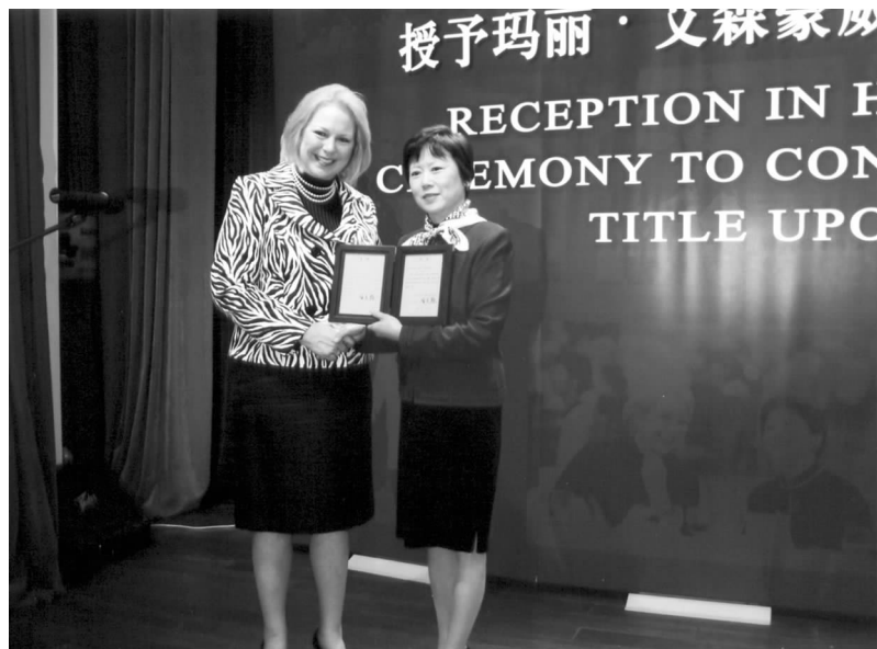
李小林副会长向玛丽·艾森豪威尔颁发“人民友好使者”证书

仪式在玛丽最喜欢的《雪绒花》动听的旋律中结束,整个礼堂沉浸在欢乐友好的气氛中。□