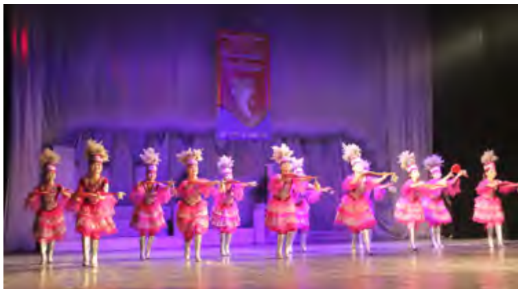
新疆少儿艺术团 表演哈萨克舞蹈