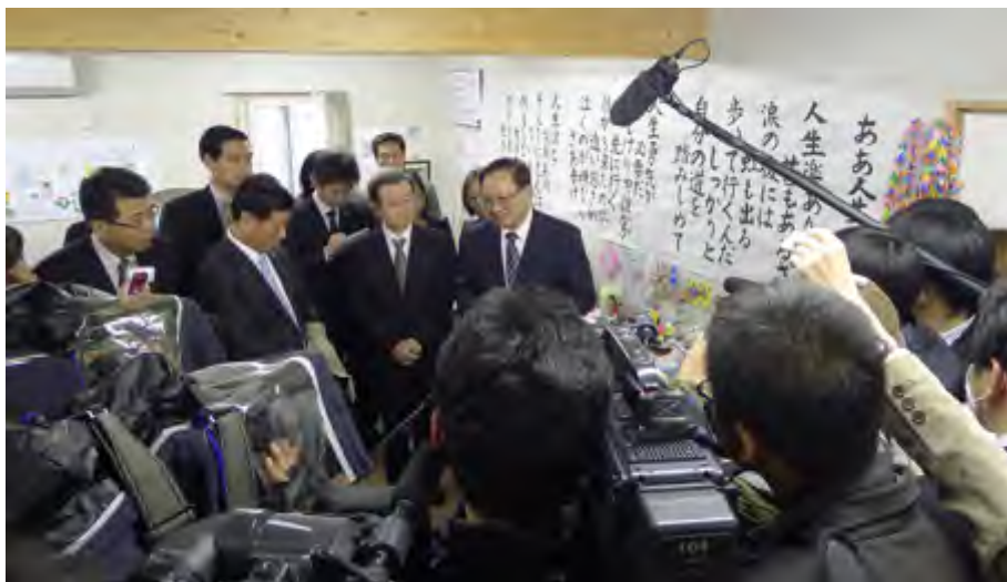
唐家璇在仙台市灾民临时住宅区接受记者采访

唐家璇会长在招待会致辞中表示：“今年是中日邦交正常化40周年。40年弹指一挥间，但中日关系经历了沧桑巨变，取得了长足发展，给两国人民带来了实实在在的利益，也为地区和世界的和平、稳定与繁荣作出了重要贡献。在中日关系重建和发展的进程中，民间友好发挥