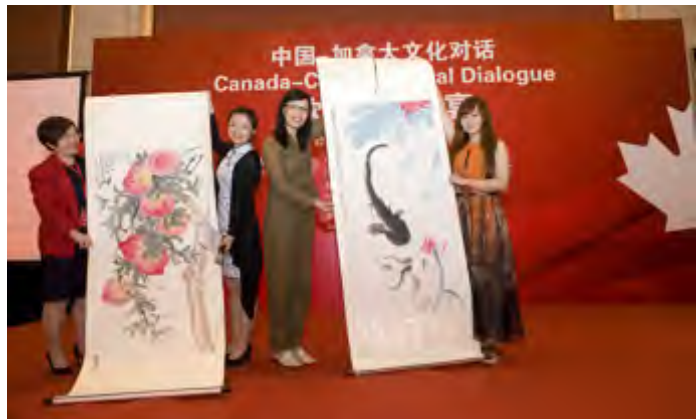
中国艺术家现场作画

台,2009年,全国友协与加拿大国际文化基金会合作,在哈珀总理访华之前,以纪念白求恩逝世70周年为主线,在北京共同发起了“中加文化对话”活动。2010年,作为中加建交40周年系列庆祝活动之一,全国友协在加拿大渥太华与加方共同举办了第二届文化对话活动。■