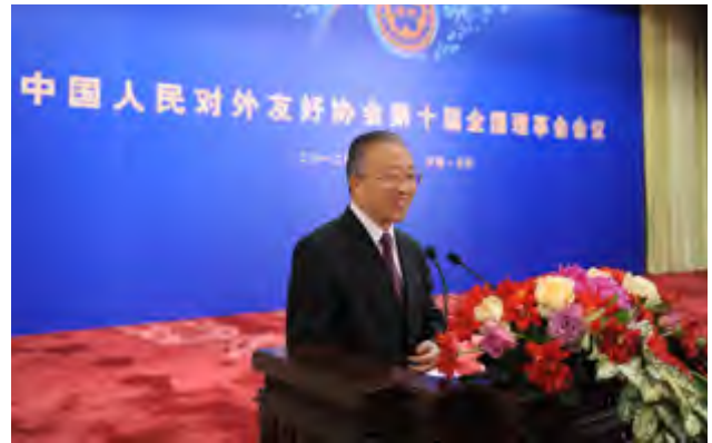
戴秉国在会议开幕式上致辞

间外交工作者使命光荣、任务艰巨。全国友协要不断开创民间外交工作新局面，做到服务国家总体外交更加有力，服务我国经济社会发展更加有效，服务地方改革开放更加有为。