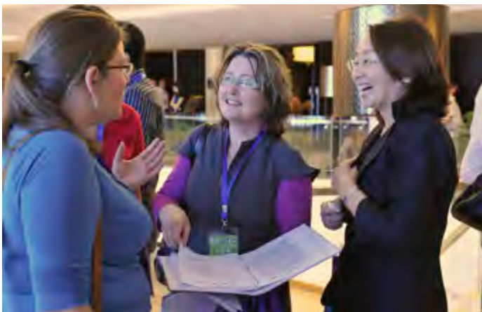
中外与会者在茶歇时亲切交谈

“2012蓬莱—未来之星”国际研讨会的规模虽然不是很大，但其影响力是深远的。它为各国青年领导人架起了知识和见解的桥梁、理解和友谊的桥梁。相信每位与会代表和有幸参与其中的人士都会享受自己独特的体验和收获。“未来之星”研讨会也将如小石城的彩色壁画和浮雕一样让人难以割舍，如人间仙境蓬莱的海浪般敲打着每个参会代表的心扉。■