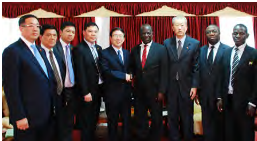
乌干达副总统塞坎迪会见代表团

全国友协与地方政府部联合举办第九届中非友好城市暨地方政府合作研讨会。代表团中来自 6 个省和自治区的地方政府官员和乌干达 20 余名市长及地方政府协会、旅游协会、商会等相关机构代表出席研讨会。双方代