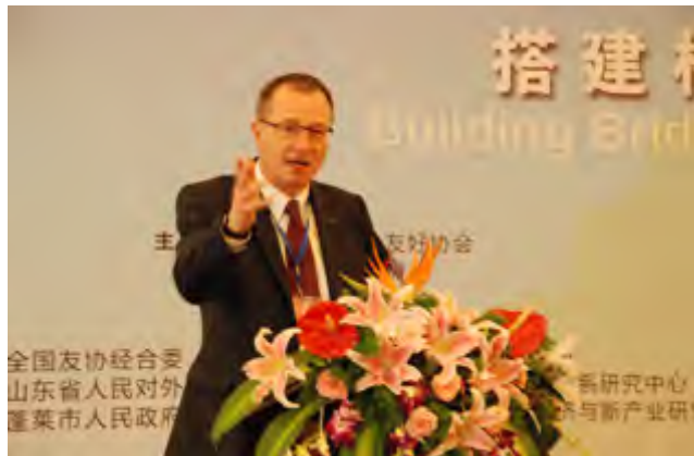
瑞士施泰因基金会主席托尼·绍宁伯格在开幕式上致辞

阿不来提·阿不都热西提副主席指出，在经济全球化深入发展的大背景下，各国之间的发展息息相关，国与国之间的依存更加紧密。未来