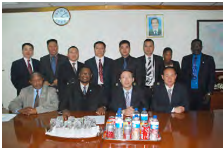
博茨瓦纳地方政府部长塞莱会见代表团