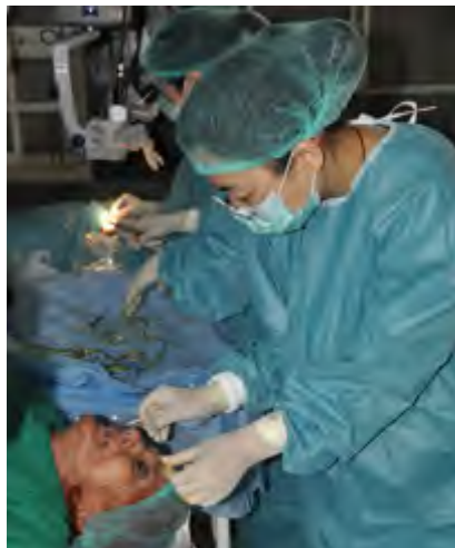
紧张工作中的中国医生

位白发苍苍、步履蹒跚的老人，希望能再加一台手术。当得知这位老人长途跋涉几个小时为的是请中国医生做手术时，医疗队立刻重新准备器材设备，为老人实施了手术。