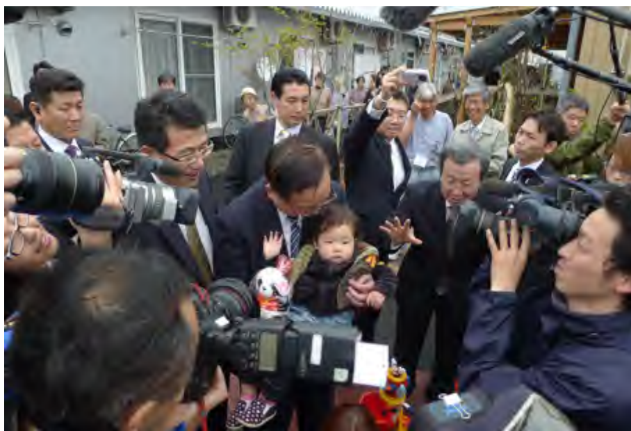
在仙台市灾民临时住宅区看望“3·11”地震灾民

了最重要的促进作用。日中友好各团体始终走在中日友好的最前列，为增进两国人民的相互了解和友谊，深化中日各领域友好与合作，推动中日关系健康稳定发展作出突出贡献。”