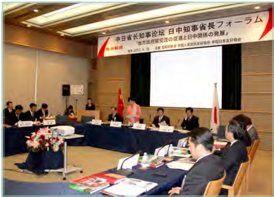
李小林会长在论坛开幕式上致辞

首届中日省长知事论坛以“加强地方政府交流，推动中日关系发展”为主题。李小林会长、程永华大使、山田启二会长、山口壮外务副大臣等在论坛开幕式上致辞。李小林会长表示，地方政府间的交流与合作是中日关系的重要组成部分，为增进两国人民的相互理解和友好感情，推动中日友好合作关系的发