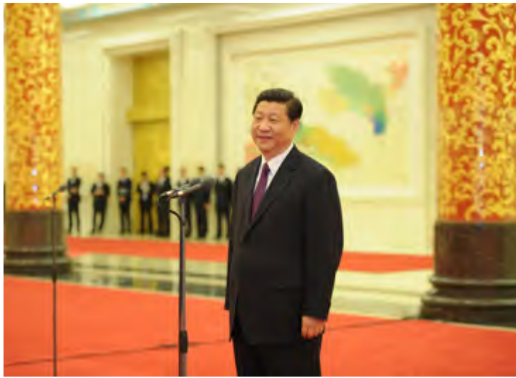
国家副主席习近平会见全体与会代表并发表重要讲话

家关系发展的基础性工作，是国家总体外交的重要组成部分。党和国家一贯高度重视民间外交。毛泽东、周恩来、邓小平、江泽民、胡锦涛等党和国家领导人率先垂范、身体力行，广交深交各国友人，并结下真挚的友谊。在他们亲切关怀和指导下，民间外交为打破帝国主义对新中国的封锁，为服务国内改革开放和现代化建设，为促进我国与世界各国人民的交流与合作发挥了重要作用。