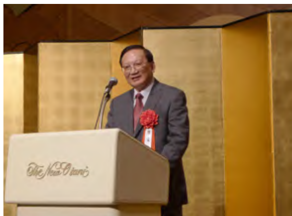
唐家璇在东京日中友好七团体举行的招待会上致辞

这是唐家璇今年3月担任中日友协会会长以来首次访日。其间，唐家璇会长与日本首相野田佳彦，外相玄叶光一郎，众议院议长横路孝弘，前首相村山富市、福田康夫、中曾根康弘，民主党干事长舆石东、政调会长前原诚司，自民党总裁谷垣禎一，公明党代表山口那津男，大家党代表渡边喜美等日本党政要人及地方政府首脑、日中友好七团体负