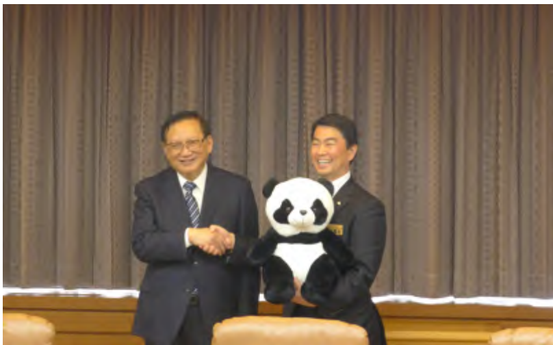
向宫城县知事村井嘉浩赠送熊猫玩具

展对日本和国际社会是机遇。今年是日中邦交正常化40周年，日方愿与中方共同努力，增进政治互信，扩大人文交流，深化互利合作，推动日中战略互惠关系进一步向前发展。