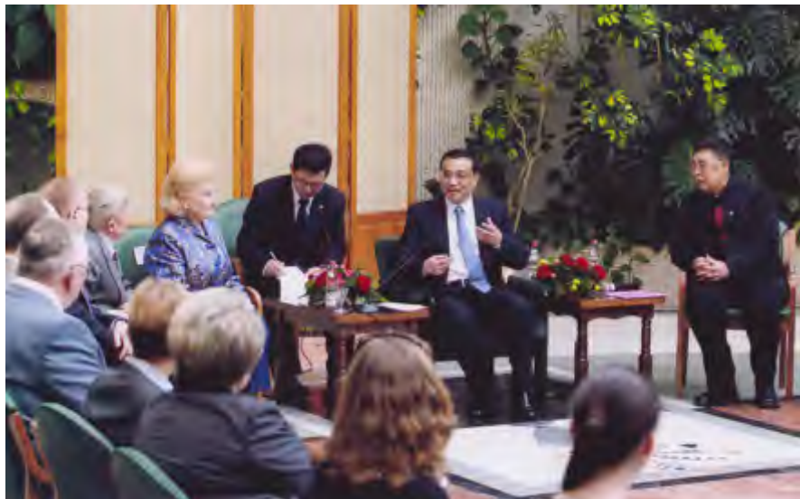
李克强副总理与中俄友好人士亲切交谈