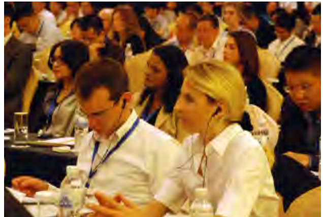
参会代表认真聆听专家大会演讲

与2011年研讨会相比，此次研讨会在日程安排上做了一些创新，如安排了“贝尔艇下水启动仪式”。贝尔艇是由英国绿色环保主义者、英前奥运会划艇教练大卫·特雷恩设计，意在宣传绿色环保、节能减排和可持续发展的理念，契合了研讨会“搭建桥梁，共促和谐”的主题，也为研讨会注入了新的元素。此外，丰富多彩的参观、交流及文化活动为代表们提供了进行深度沟