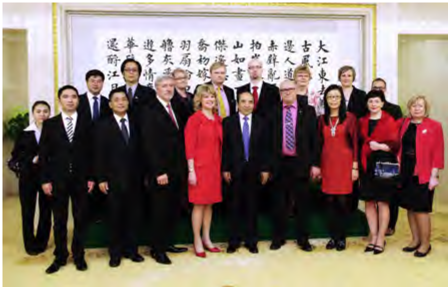
阿不来提·阿不都热西提副主席会见芬兰地方政府和教育代表团

阿不来提·阿不都热西提副主席说，此次，你们是应全国友协邀请访华的。全国友协是我国从事民间外交事业的全国性人民团体，它以增进人民友谊、推动国际合作、维护世界和平、促进共同发展为宗旨。几十年来，它为中外友好关系的发展、促进各领域的交流与合作作出了积极的贡献。受中国政府委托，全国友协负责协调管理中国与世界各国建立友好城市（省州）的工作。中芬两国在友城方面的交流也取得了可喜的成果。目前，两国共有19对友城（省州）关系。多年来，东芬兰行政省区与全国友协保持着良好的交往关系。希望今后你们加强交往和合作，为两国友好事业不断作出新贡献。■