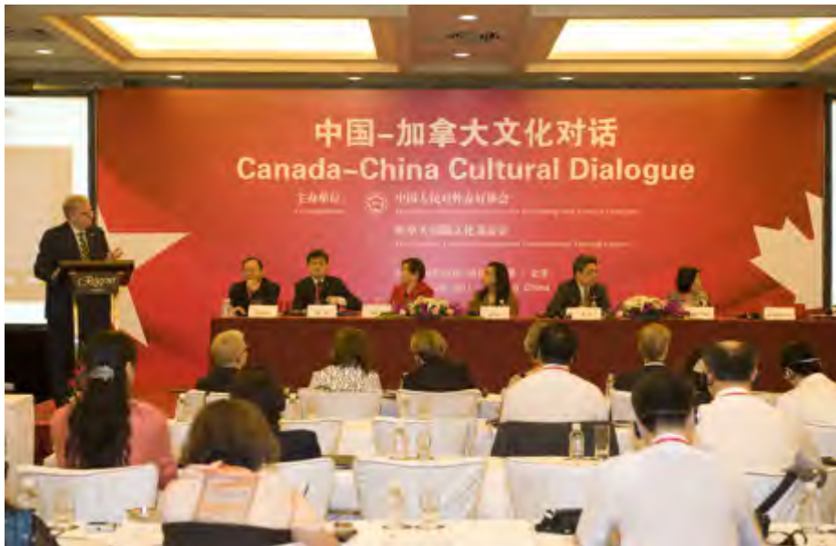
中加文化对话会场

对话活动期间，两国代表除相互介绍各自开展的丰富多彩的文化活动的同时，更强调务实合作的重要性，纷纷向对方推介自己的合作意向。中加双方的文化机构根据自己的兴趣和需要，分别寻找各自的合作对象，进行面对面的洽谈，探讨合作的可能性，最后，达成共识