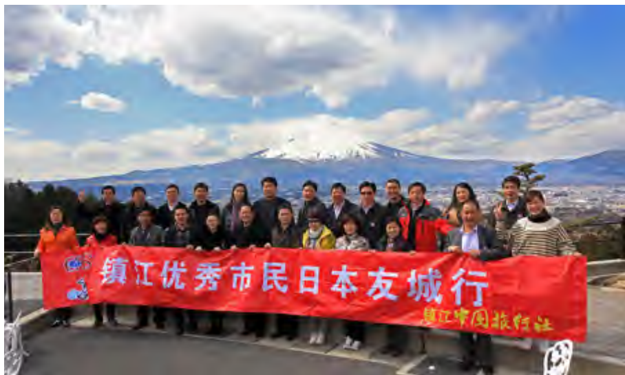
镇江市民团出访日本

镇江市民注意到，日本街道看不到一个垃圾桶，但都干净整洁，原因在于日本的垃圾箱都设在背街小巷，且细分为多个类别。那么，日本市民是如何投放垃圾的呢？他们的做法是政府部门向每家每户免费发放“提醒日历”，日期上面标