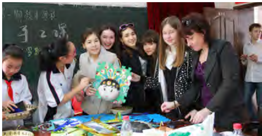
共同制作手工作品

体验学校特色课。4月9日至10日，俄罗斯师生在学道分校活动两天。他们随结对学生一起，进课堂听课学习，到操场课间锻炼，入食堂随同学一起午餐，真正体验了成都孩子丰富多彩的校园生活。学