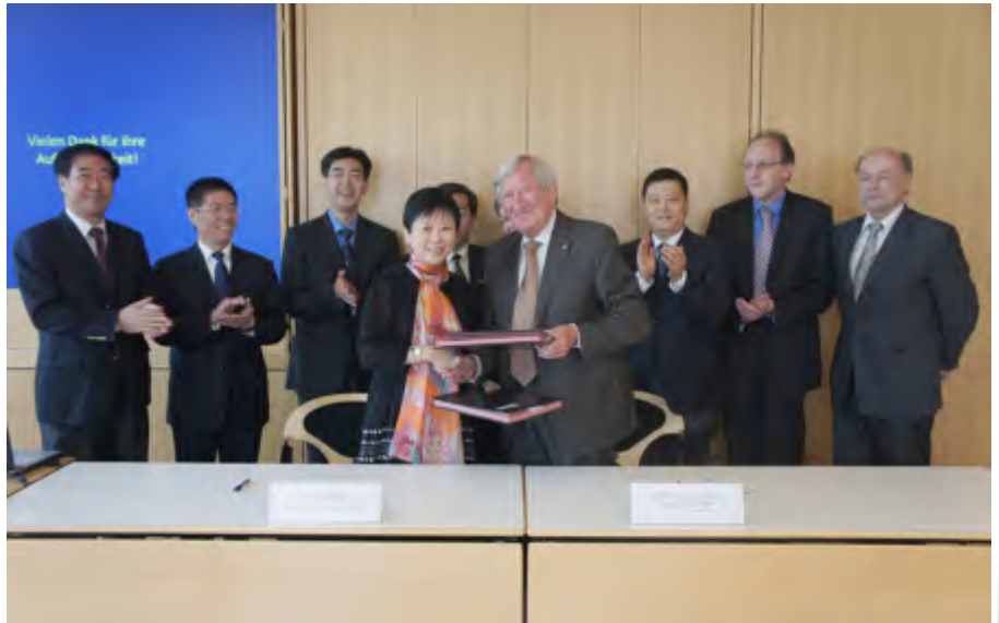
同赛德尔基金会签署合作协议

成立于1967年的赛德尔基金会是德国五大政治基金会之一，早在1979年即通过我会开展对华合