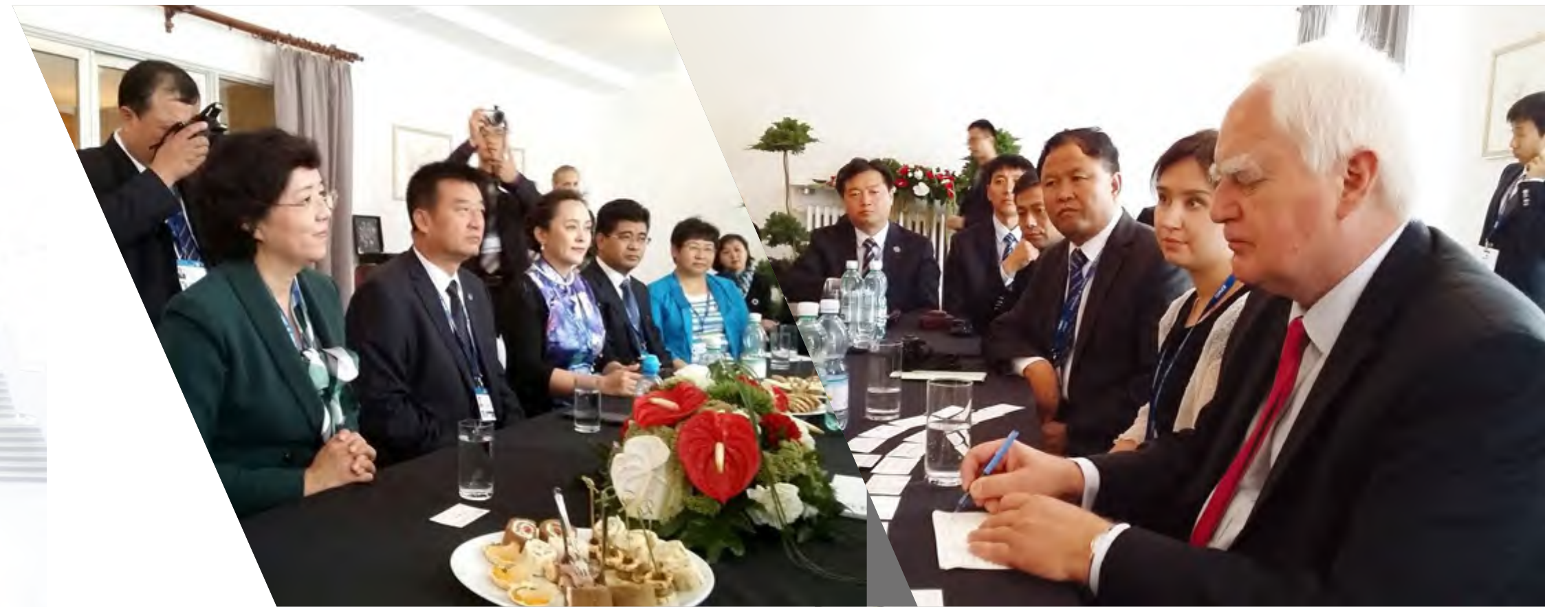
波兰总统府国务秘书吉科恩斯基与代表团全体成员座谈