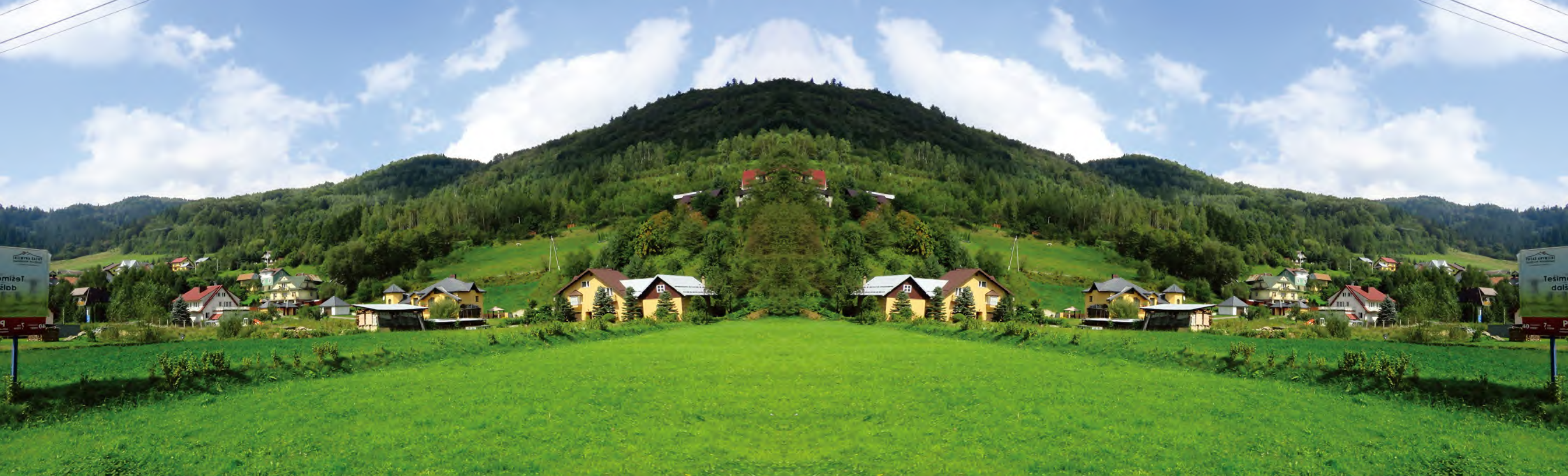
依山小镇 宜居和谐