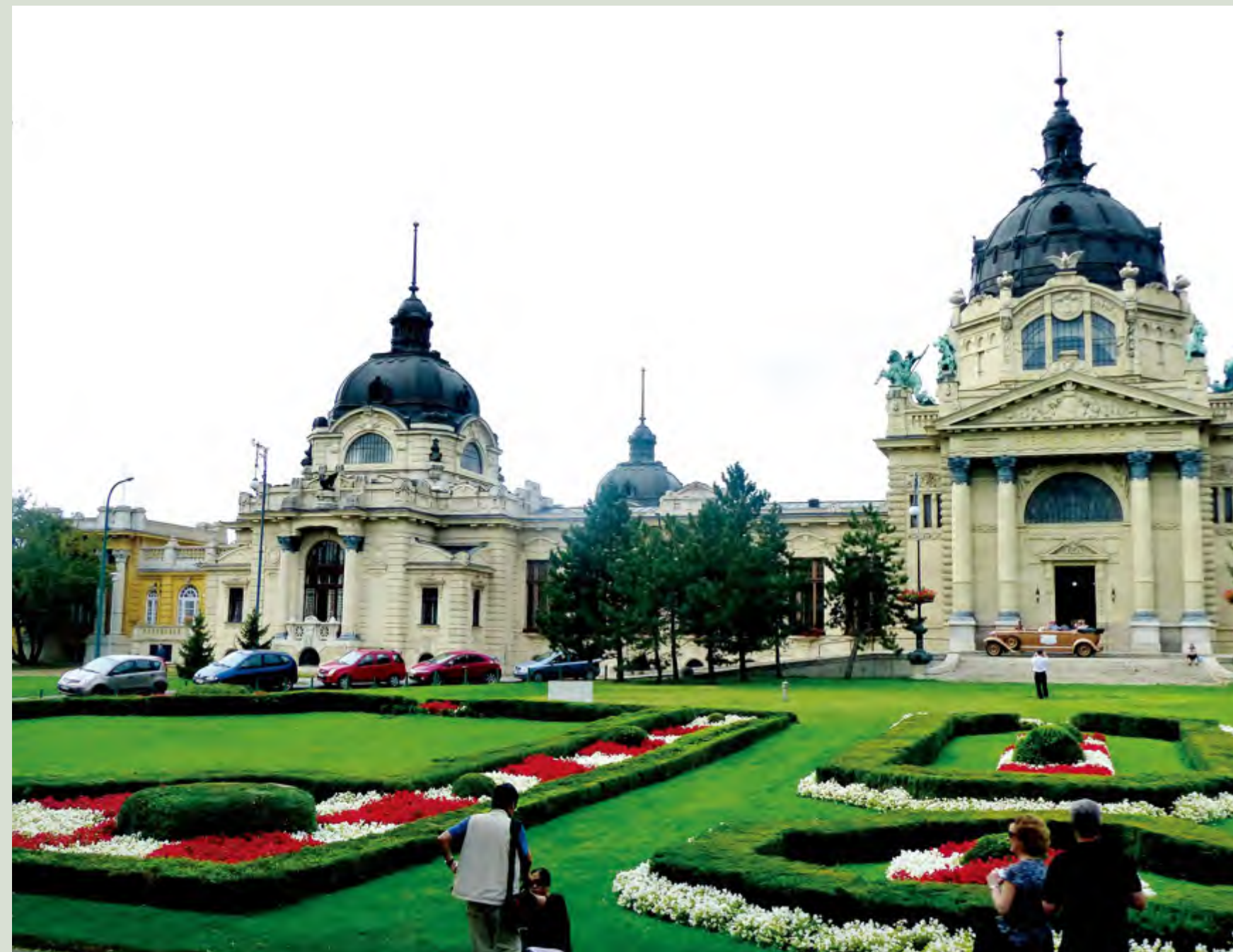
欧式建筑风格在人工绿化的衬托下更显动人