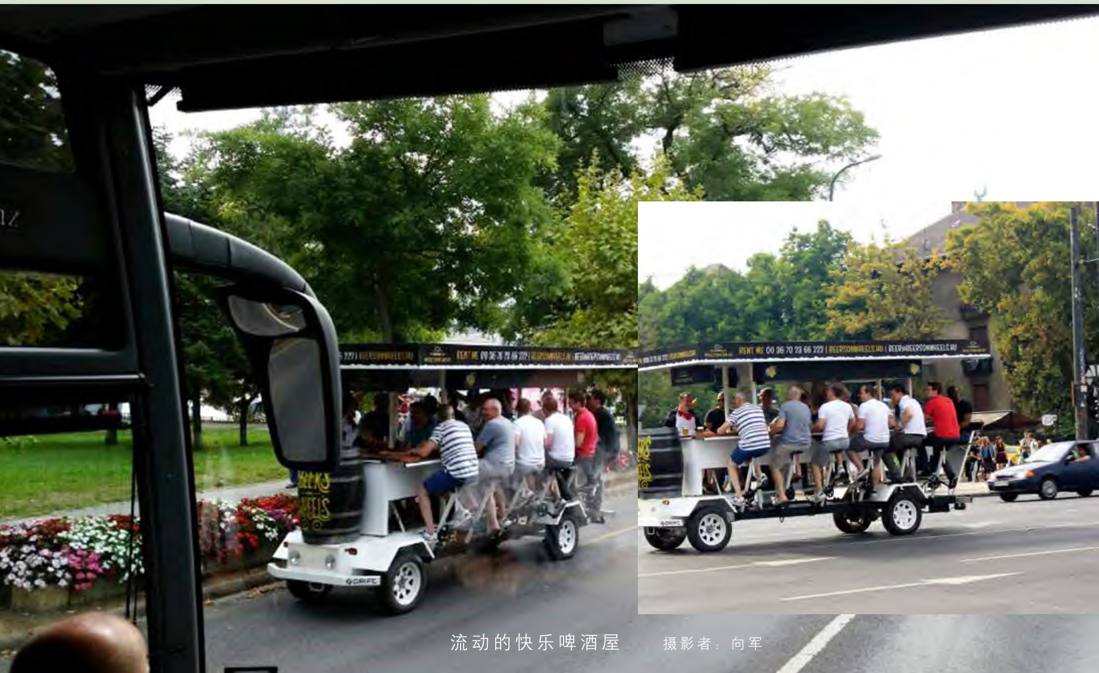
流动的快乐啤酒屋