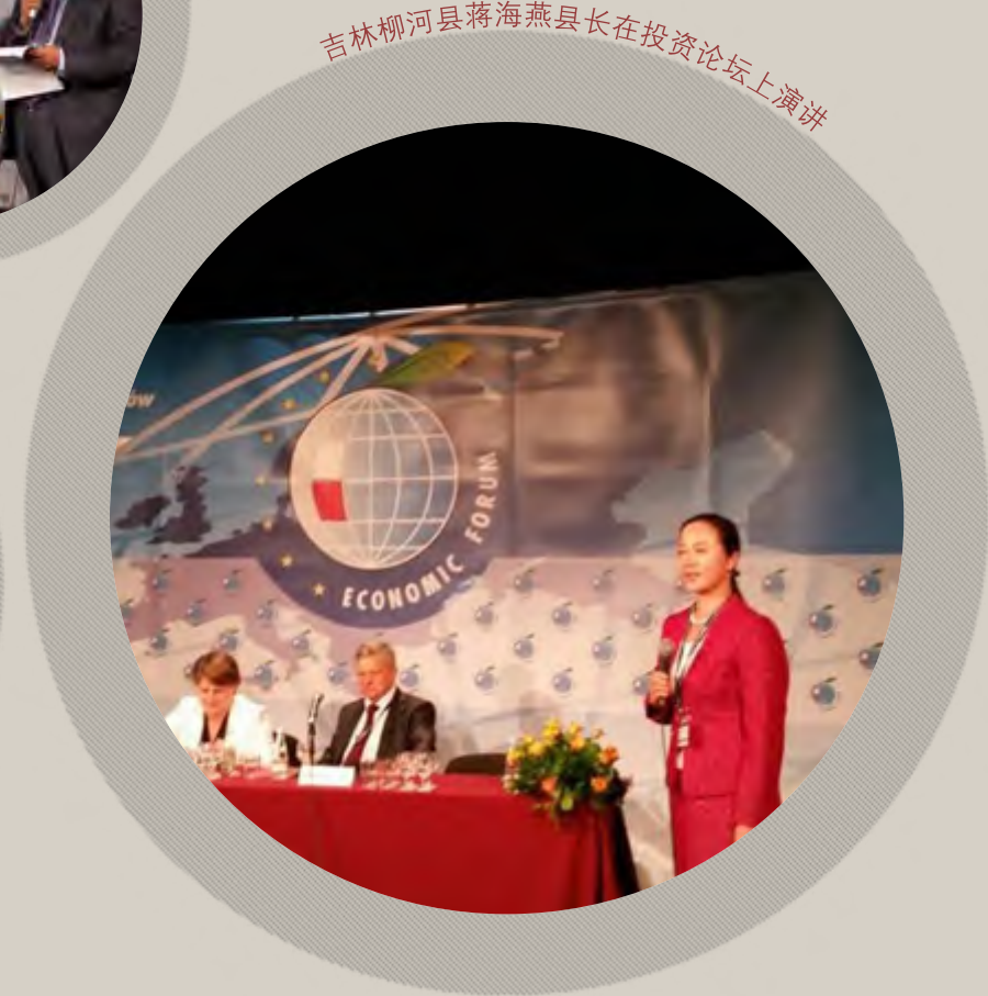
吉林柳河县蒋海燕县长在投资论坛上演讲