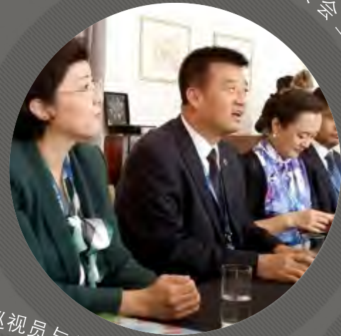
湖北省外事侨务办公室严新桥副巡视员与匈牙利外交官交谈