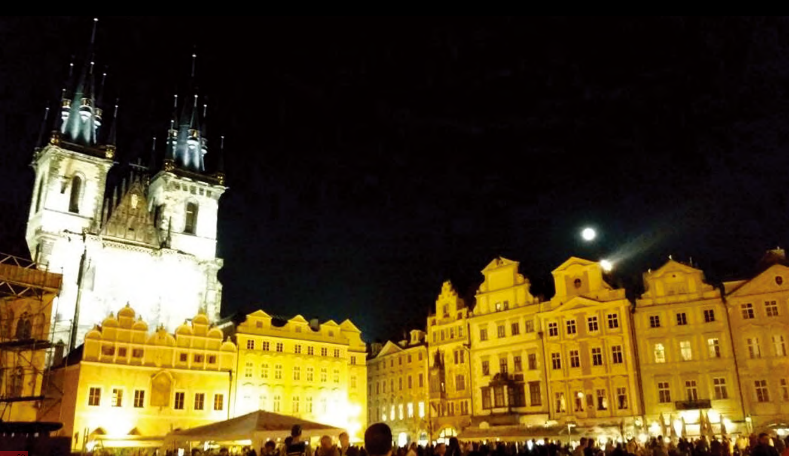
布拉格八月十五的月亮