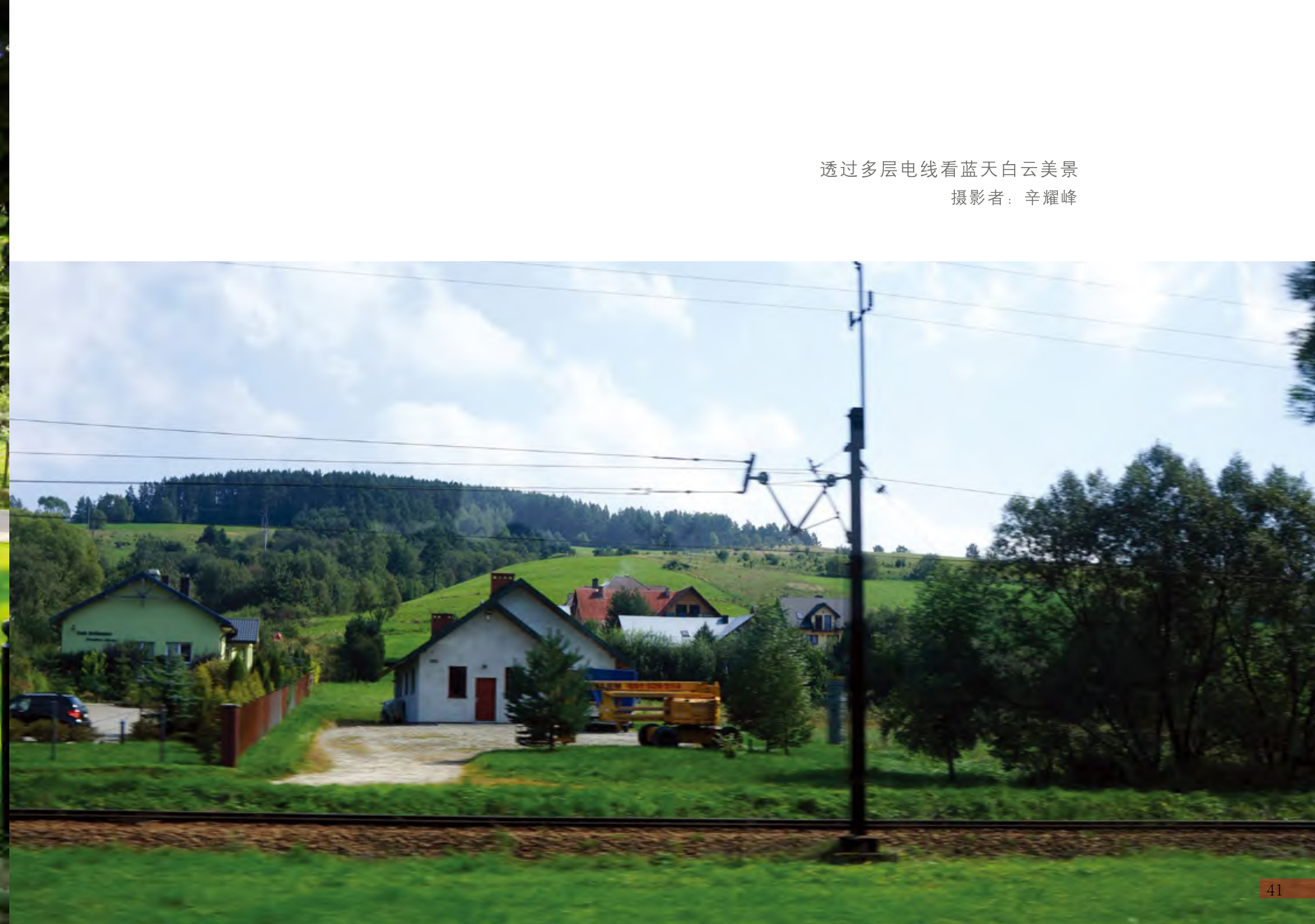
透过多层电线看蓝天白云美景