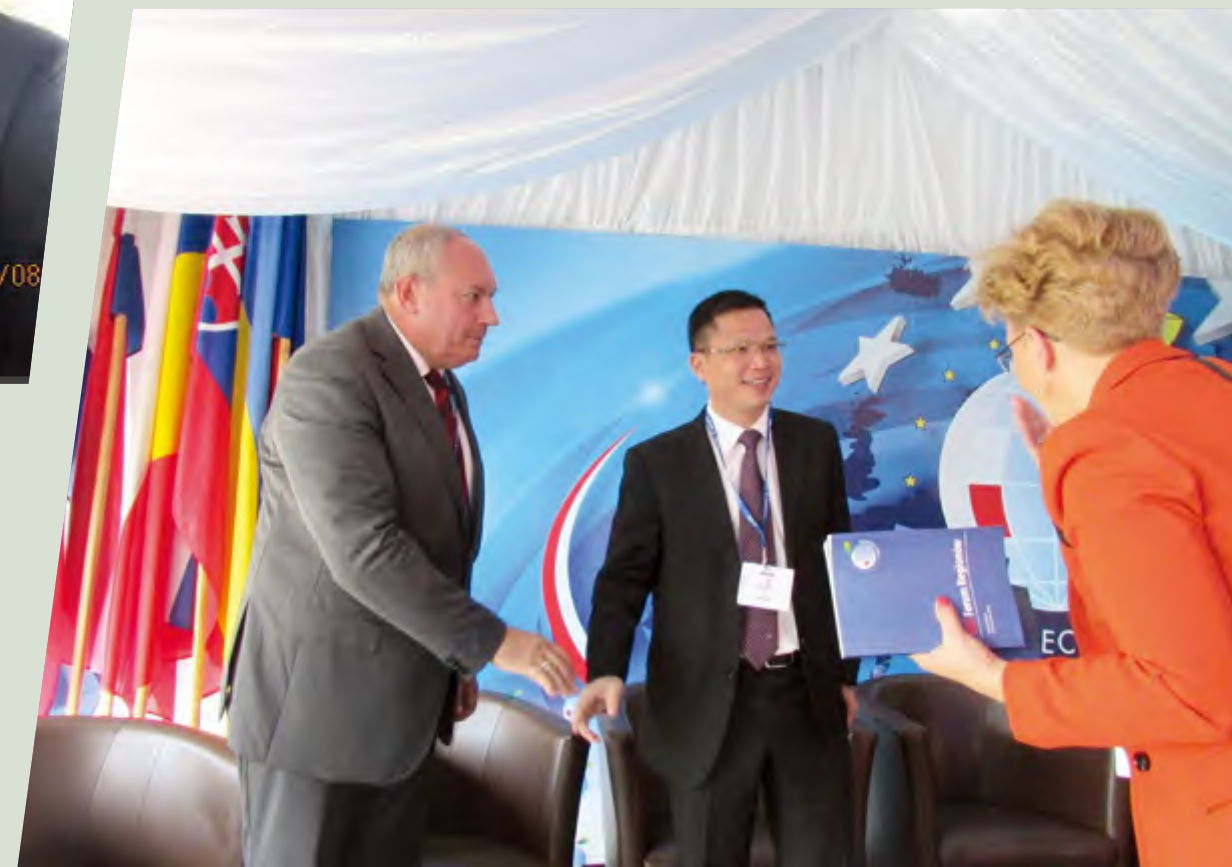
江西寻乌县杨永飞县长的演讲受到外宾的热烈赞扬