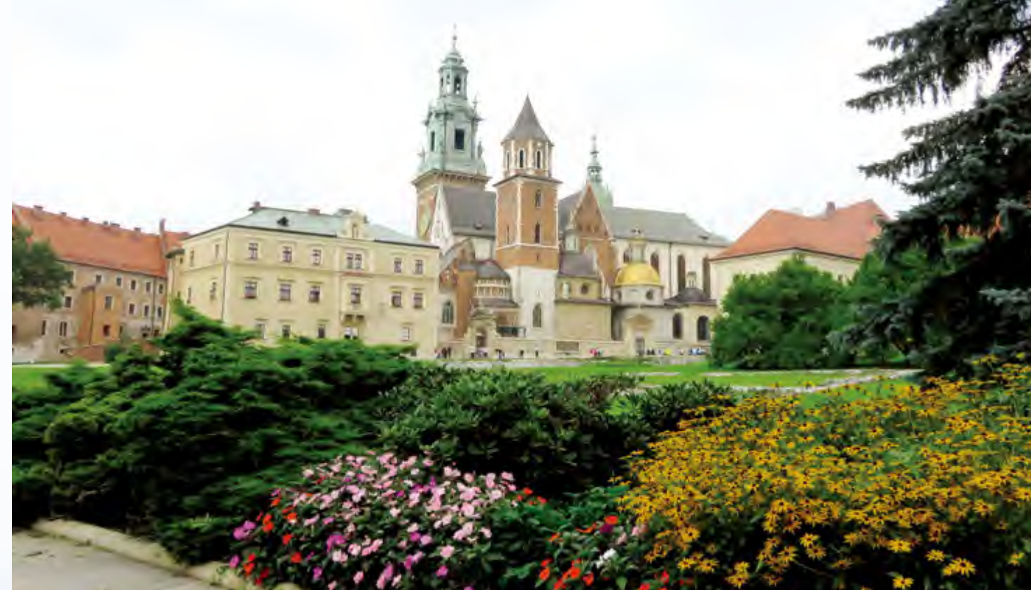
花园中的城市