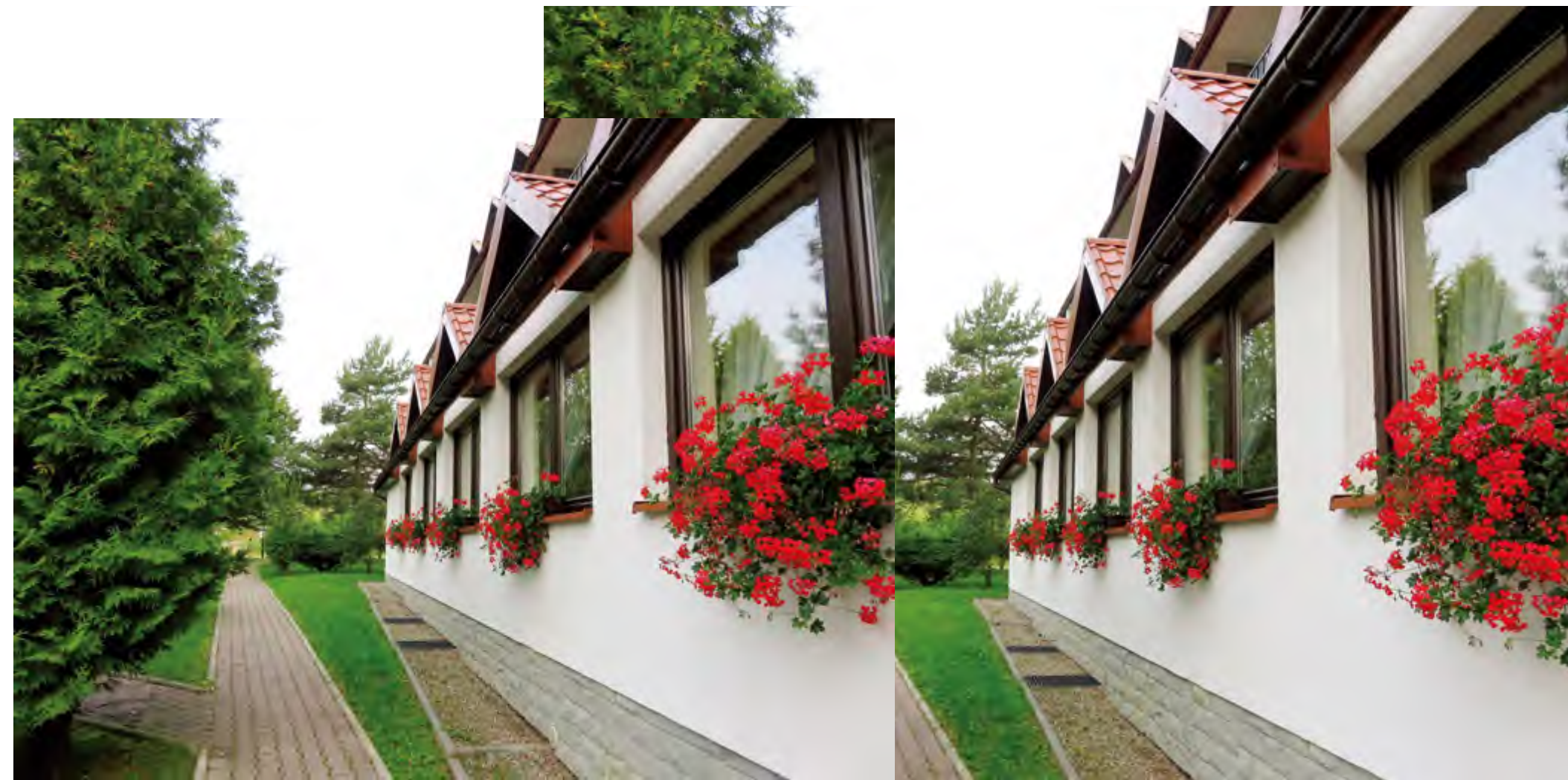
用花草装点窗台，也许是美化环境的一种方式