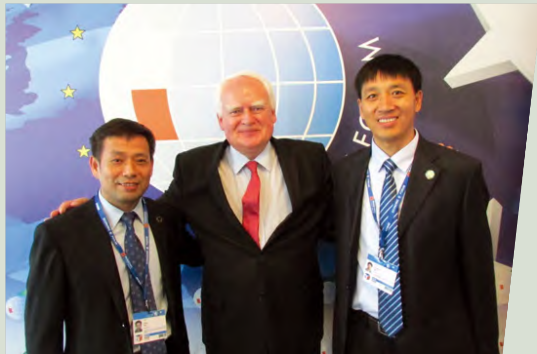
企业家代表与波兰总统府国务秘书吉科恩斯基合影