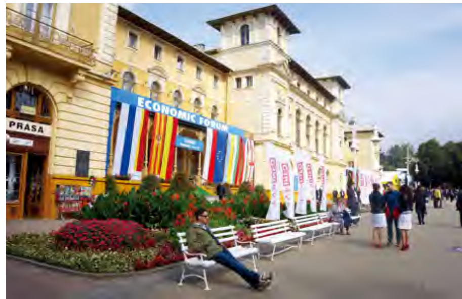
第24届东欧经济论坛小镇——克里尼察