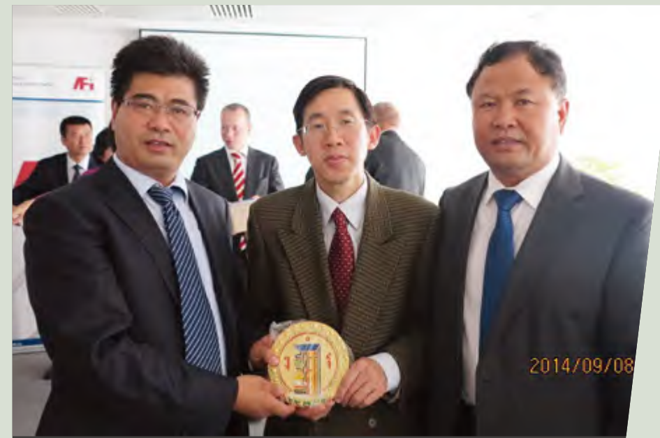
甘肃代表团与我驻捷克大使馆程永如参赞合影