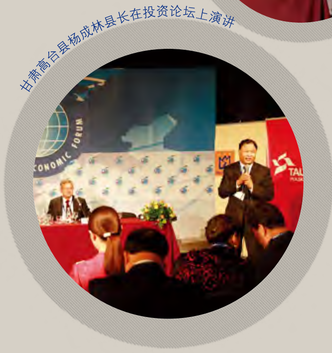
甘肃高台县杨成林县长在投资论坛上演讲