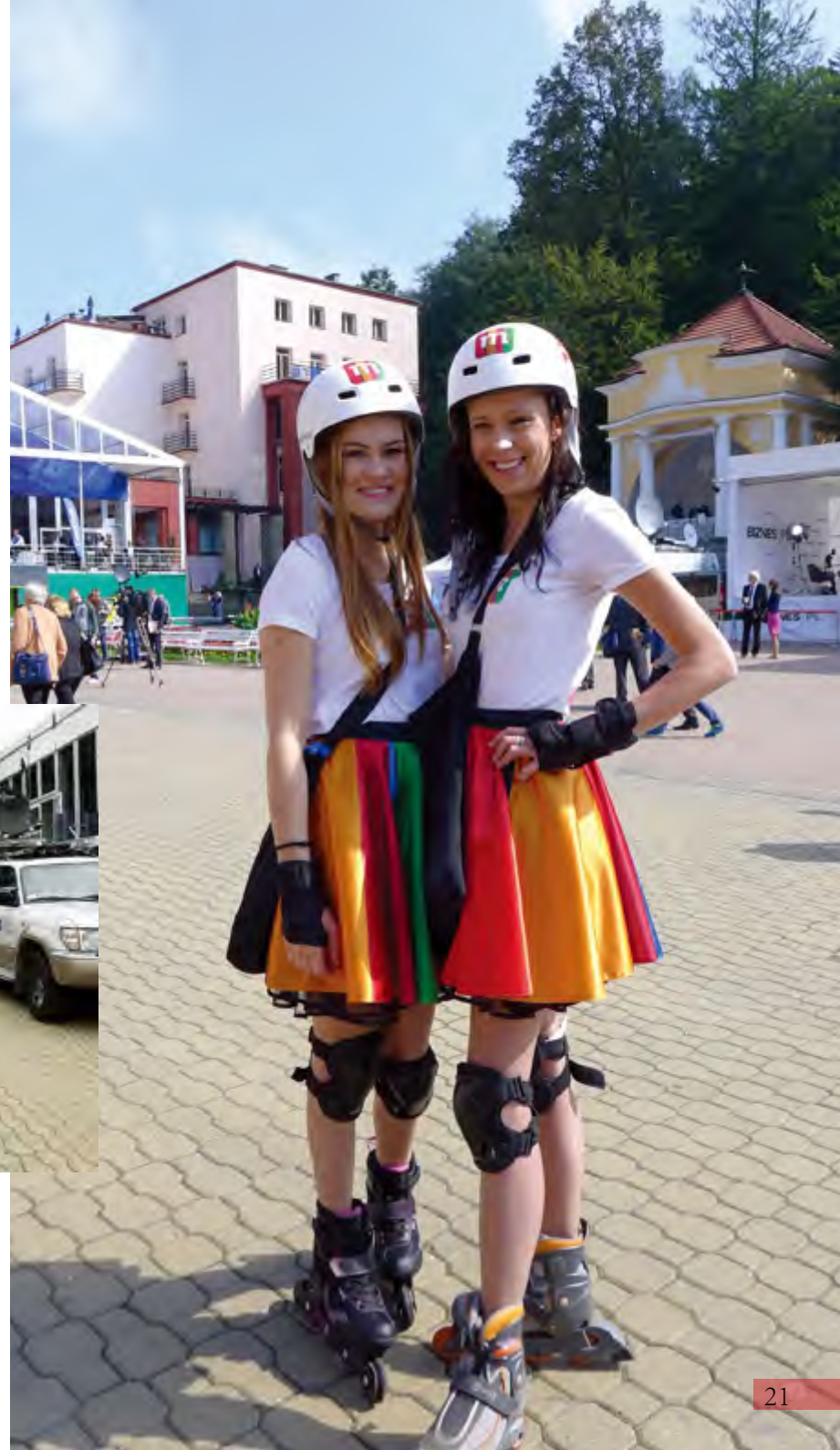
论坛之花