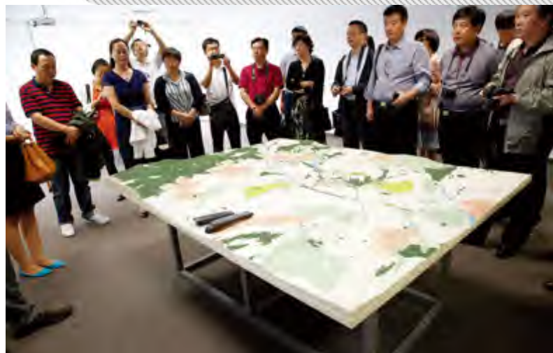
代表团参观布达佩斯“达城”并交流新城设计规划