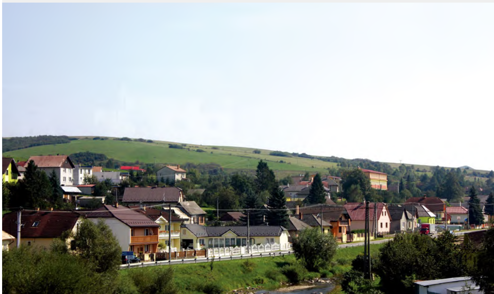
途中的斯洛伐克小镇