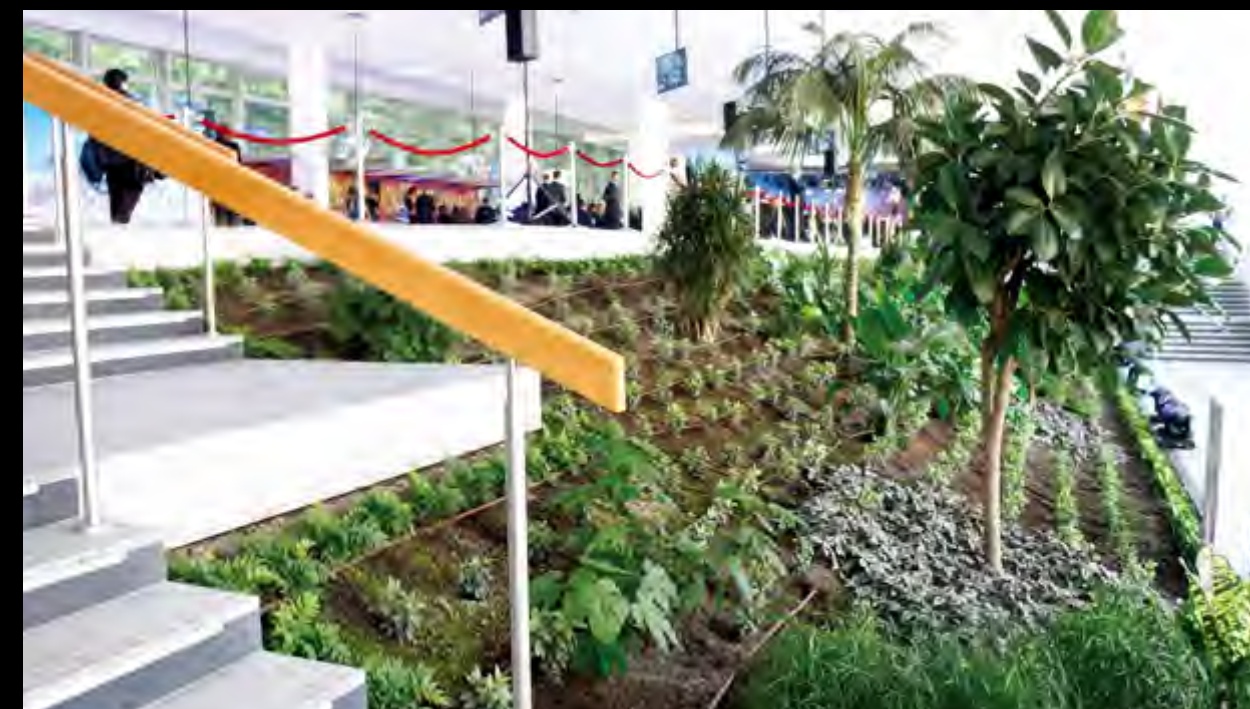
论坛主会场绿意昂然 真正体现绿色低碳