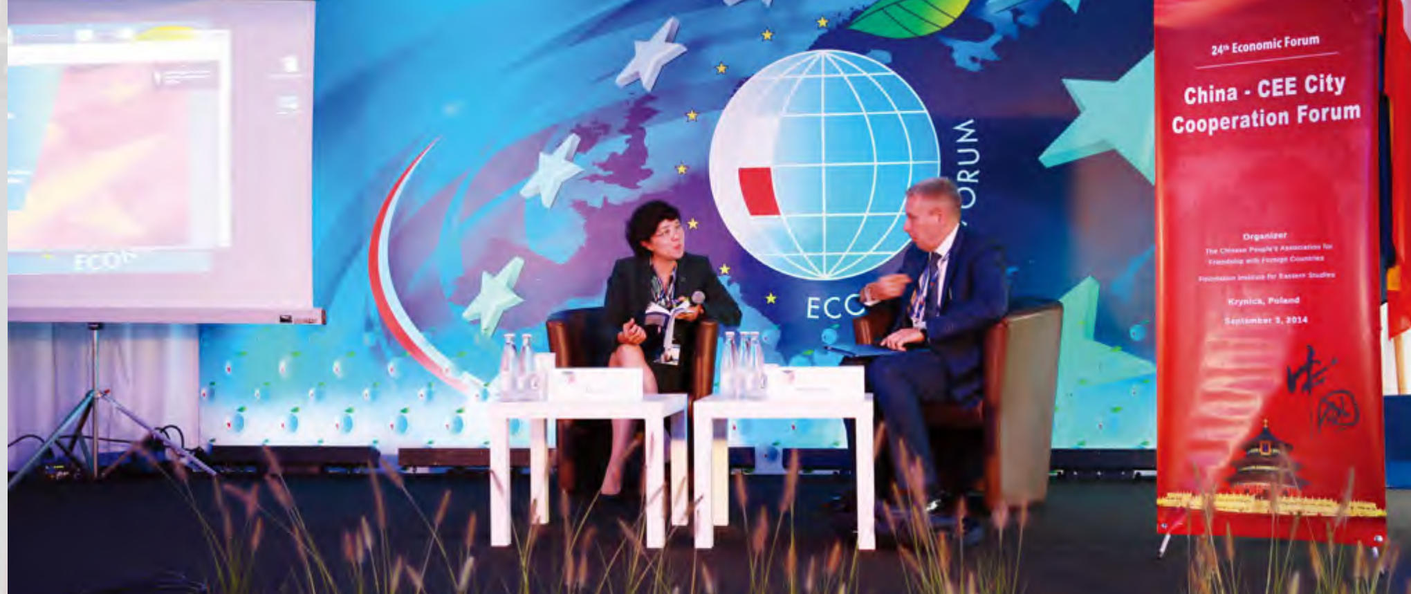
各省代表在 “中国—东欧城市合作论坛”上演讲