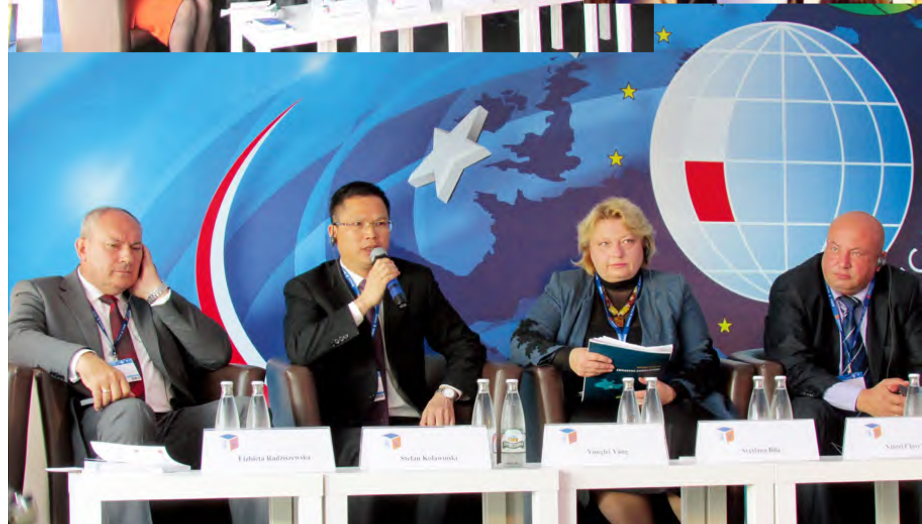
江西寻乌县杨永飞县长在“智慧小城”分论坛上发言