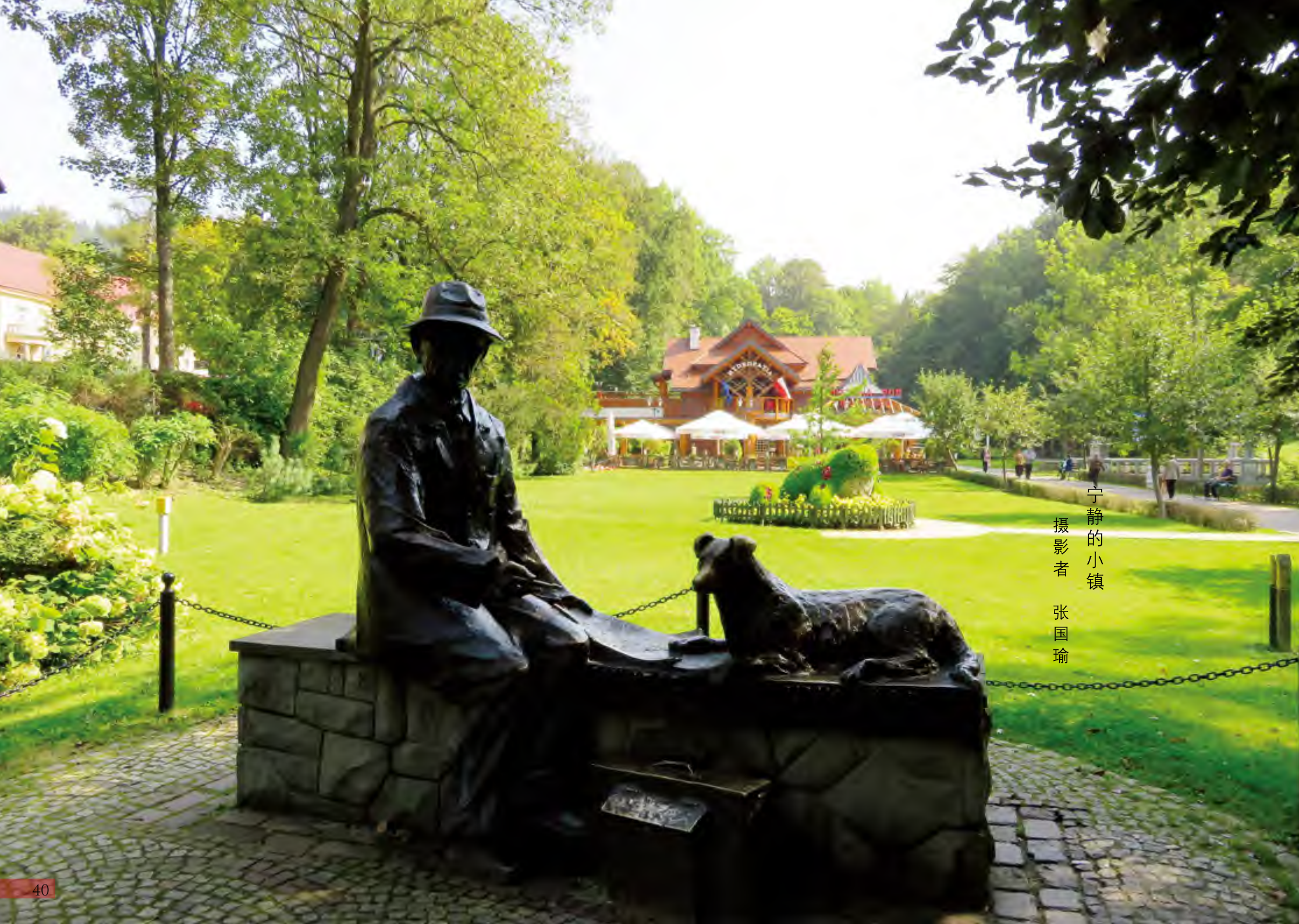
宁静的小镇