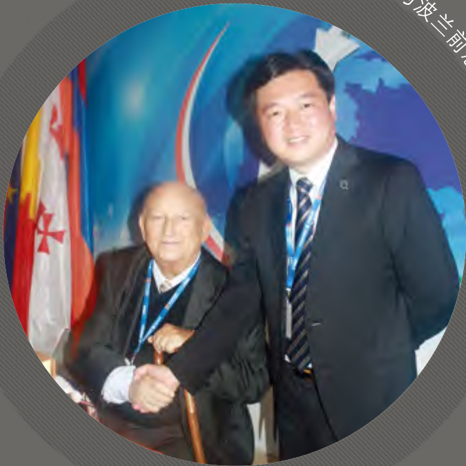
湖北来凤县向军县长与波兰前总理奥莱克西合影