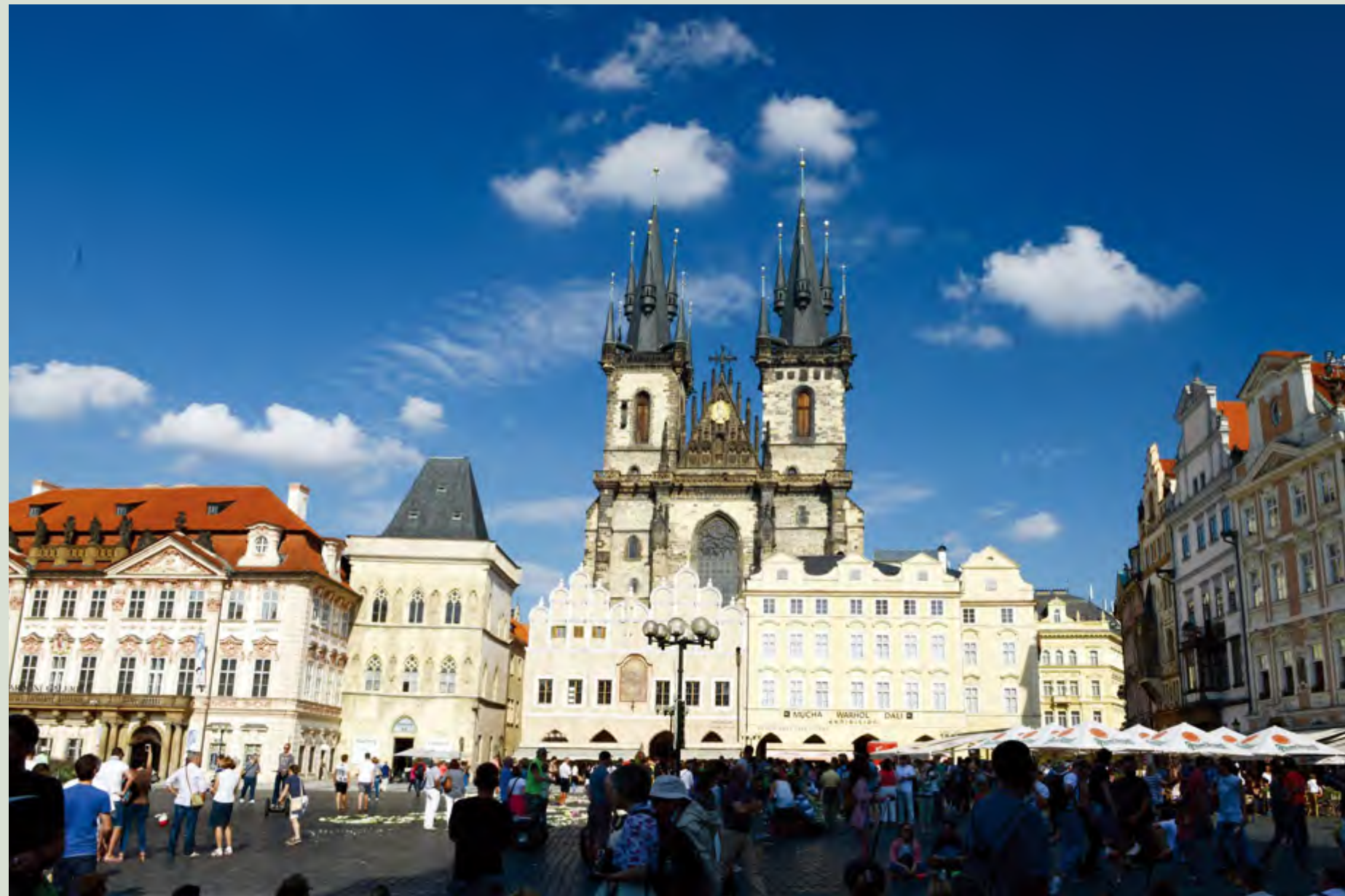
古老的建筑标志着古老的文化