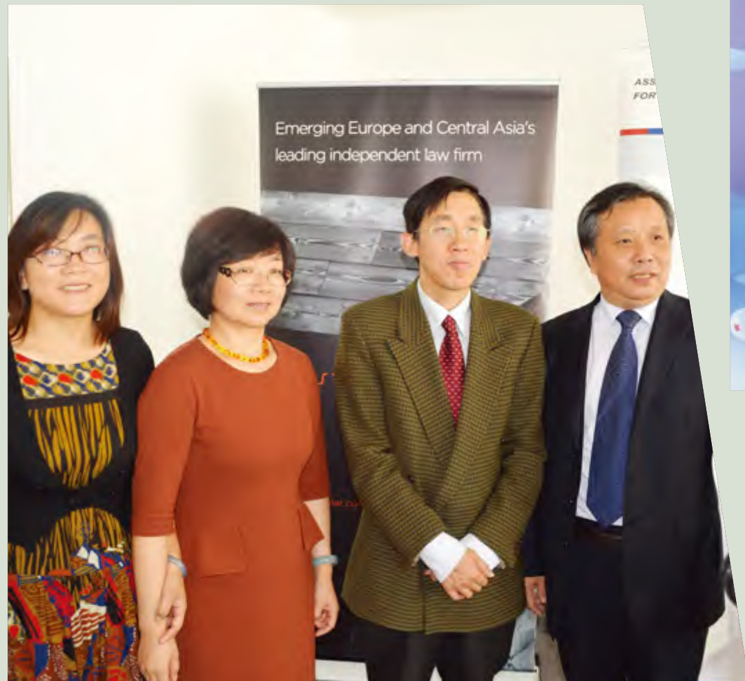
江西代表团与我驻捷克大使馆程永如参赞合影