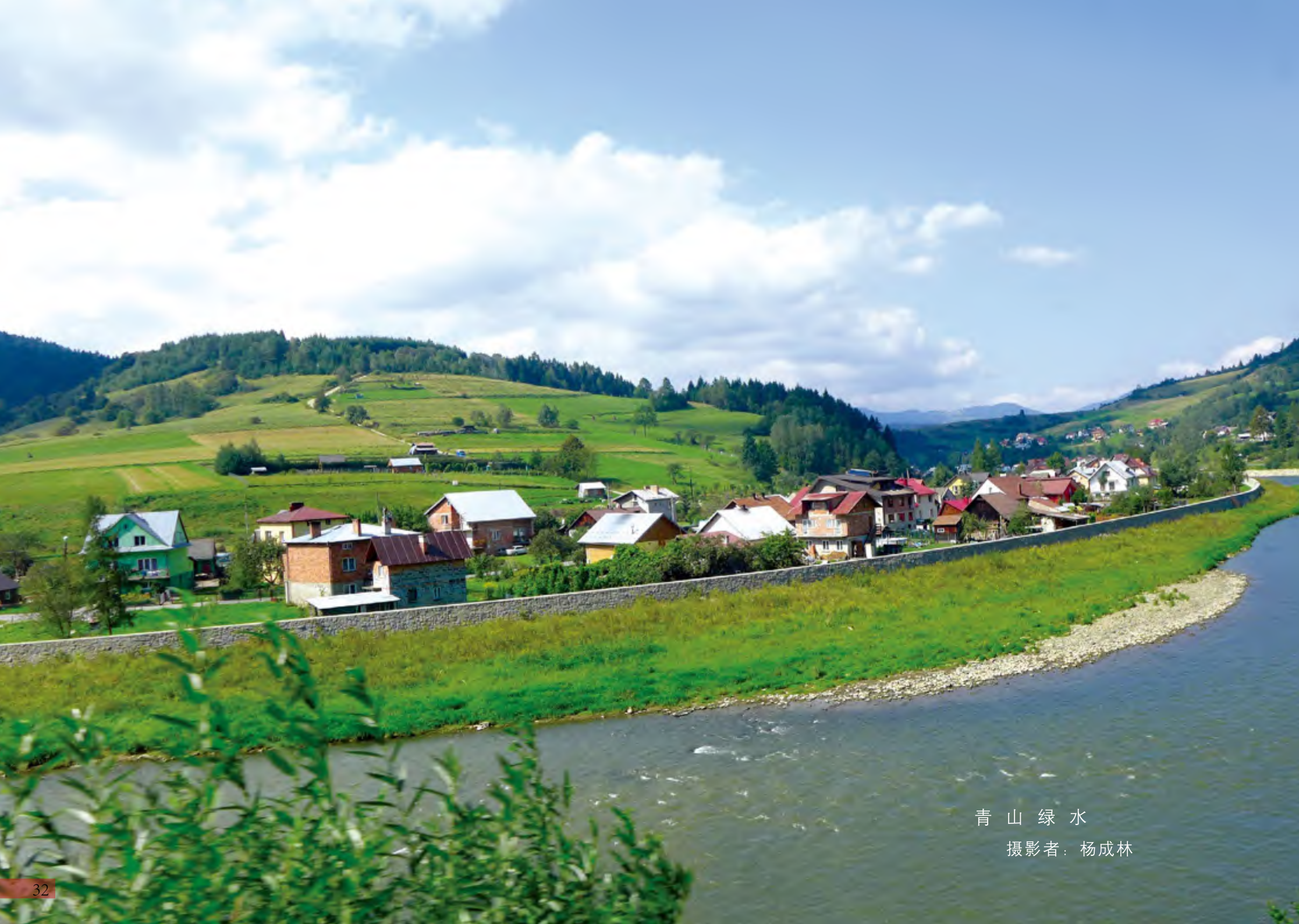
青山绿水