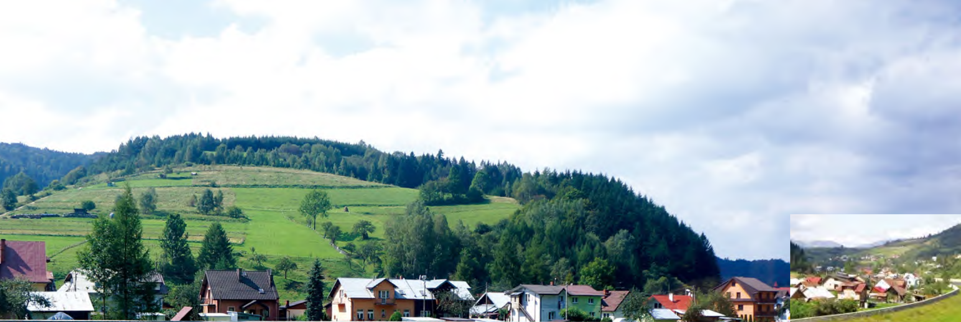
小河流水人家