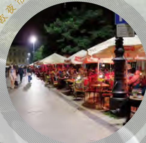
东欧夜市