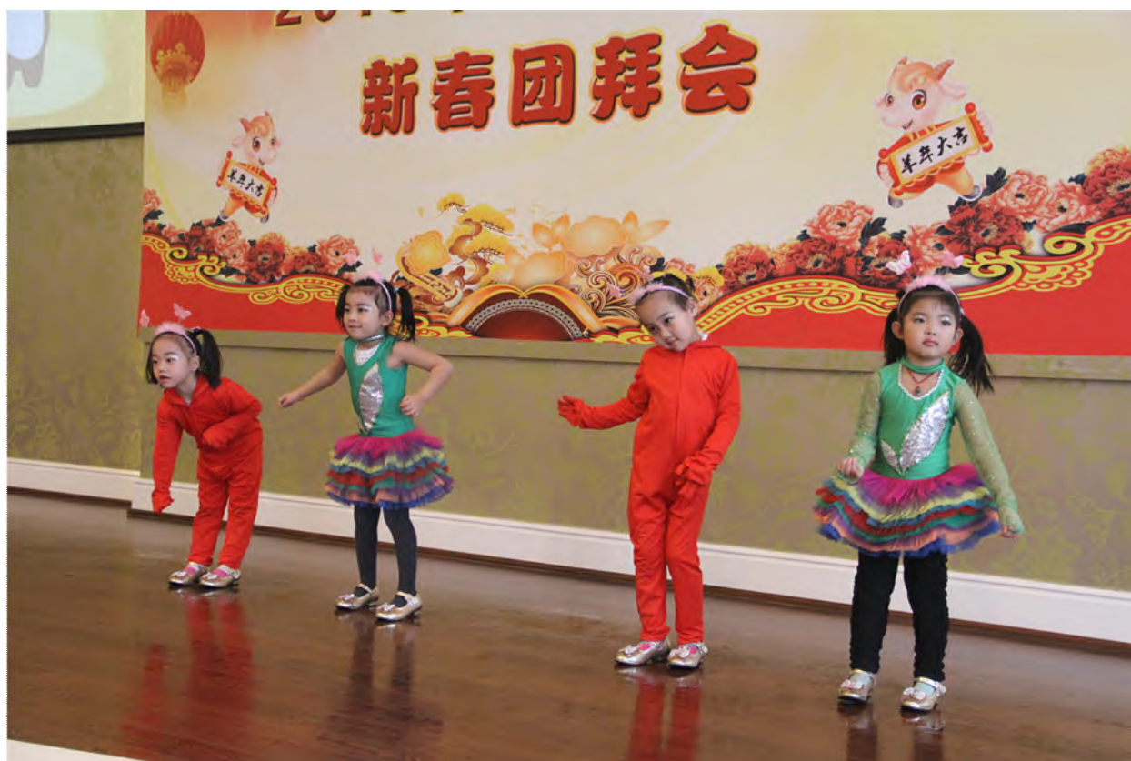
新春团拜会上小朋友为离退休同志表演节目