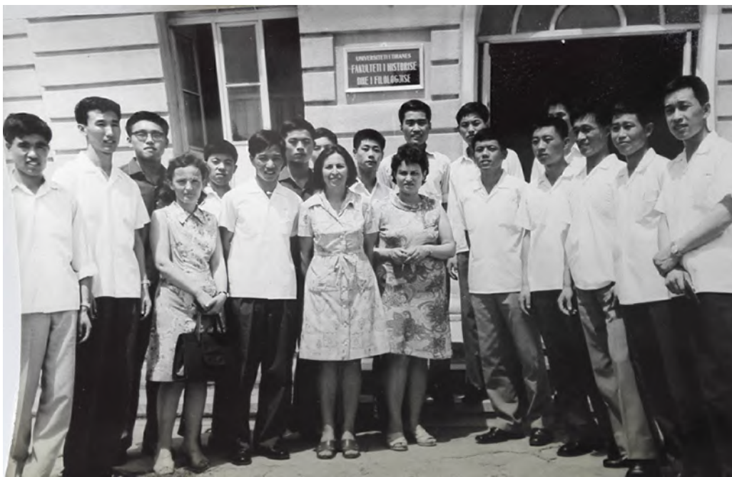
前排右起第五位是本文作者

从1973年2月开始，大批赴欧洲的小留学生乘坐火车历时一星期经莫斯科转往不同的国家。我们当时是唯一的军队留学人