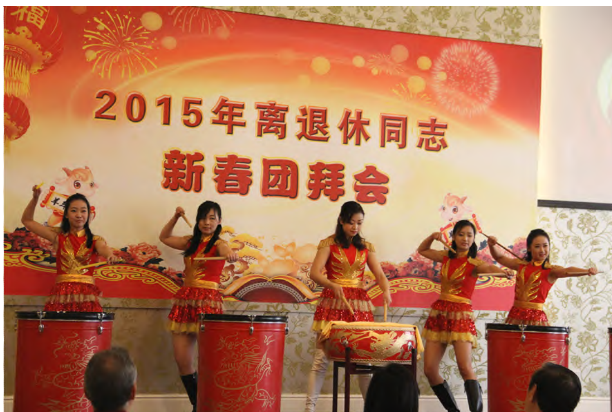
友协新人为离退休同志表演节目