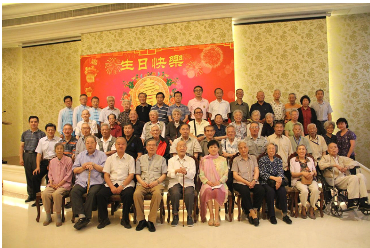
会领导与寿星们合影