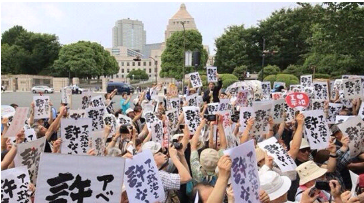
图为日本群众举着金子兜太先生书写的“零容忍安倍政治”标语游行

促官”独具特色而又深入人心的优良传统，民间外交大创辉煌。我们深切缅怀为开拓中日民间友好事业而呕心沥血的先贤前辈们。我相信，在今后的日子里，我会同仁将继续发扬传统，迎难而上，与中日两国有识之士一道为推动两国关系早日回归正常发展轨道而不懈努力。“前事不忘后事之师”，作为一个长期从事中日民间友好工作的老者，我衷心希望中日两国人民铭记历史，永不兵戎相见。