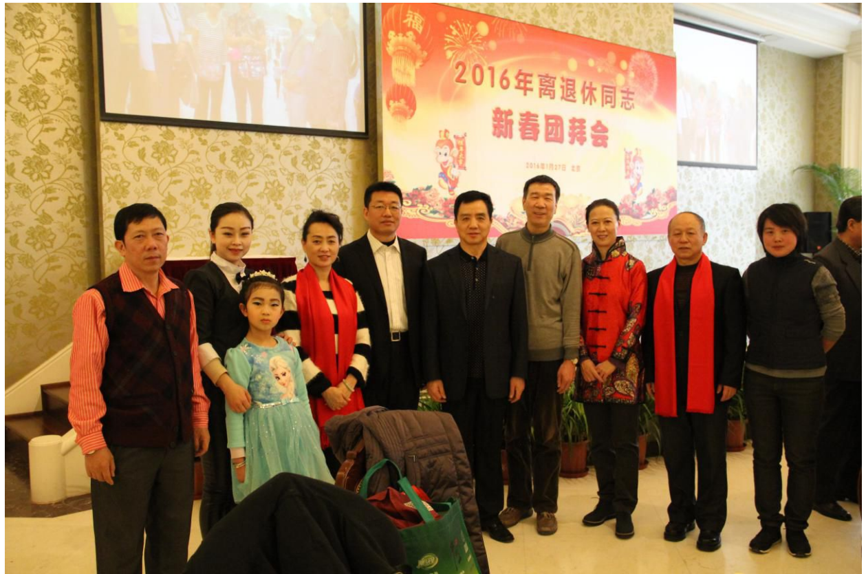
新春团拜会后离退办工作人员合影