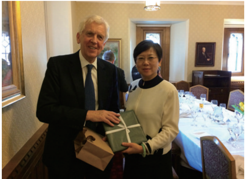
鲍威尔勋爵会见李小林会长

去年习主席访英，两国建立了面向 21 世纪全球全面战略伙伴关系，开启了中英关系“黄金时代”。在发表的《联合宣言》中指出，双方对彼此的重大倡议，即中方“一带一路”倡议和英方基础设施升级投资计划及“英格兰北方经济中心”开展合作抱有浓厚兴趣。在此后的中英重要双边会晤上，两国政府领导人均多次表示加强区域发展战略对接的愿望，其中包括“长江经济带和英格兰北方经济中心”战略对接。在习主席访英前夕，在伦敦召开的中英高级别人文交流机制第三次会议上，双方就加强地方合作达成一致。同时，作为中英地方合作双方牵头单位，我会与英国社区和地方政府事务部签署了《关于加强中英地方关系的谅解备忘录》，并商定于 2016 年初在英国启动中英地方领导人会议。双方确定了首次中英地方领导人会议主题为“长江经