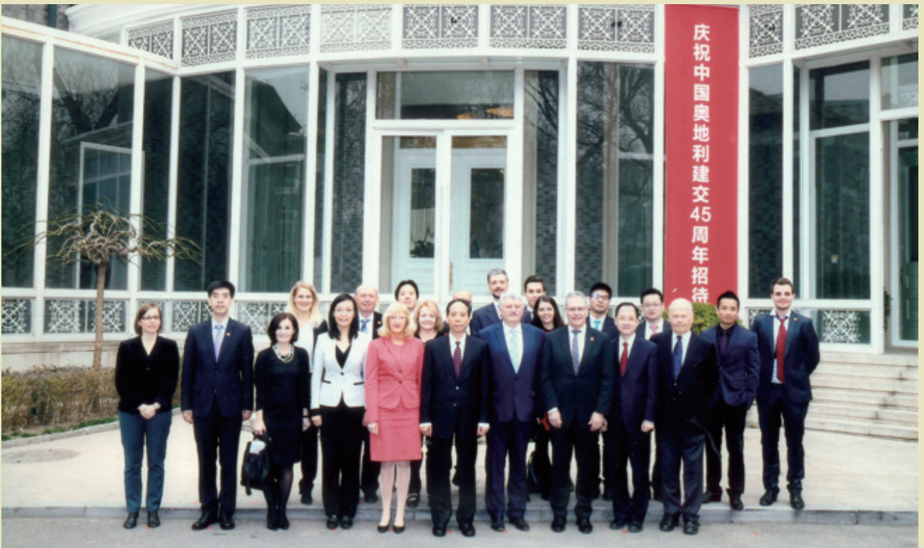
全国人大常委会副委员长吉炳轩出席中国奥地利建交45周年招待会