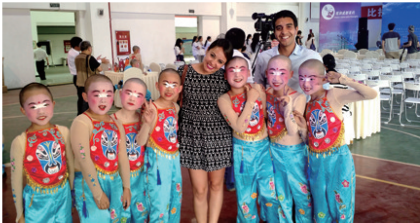
2015年萨博潘，2名来蓉研修公务员与川剧小演员