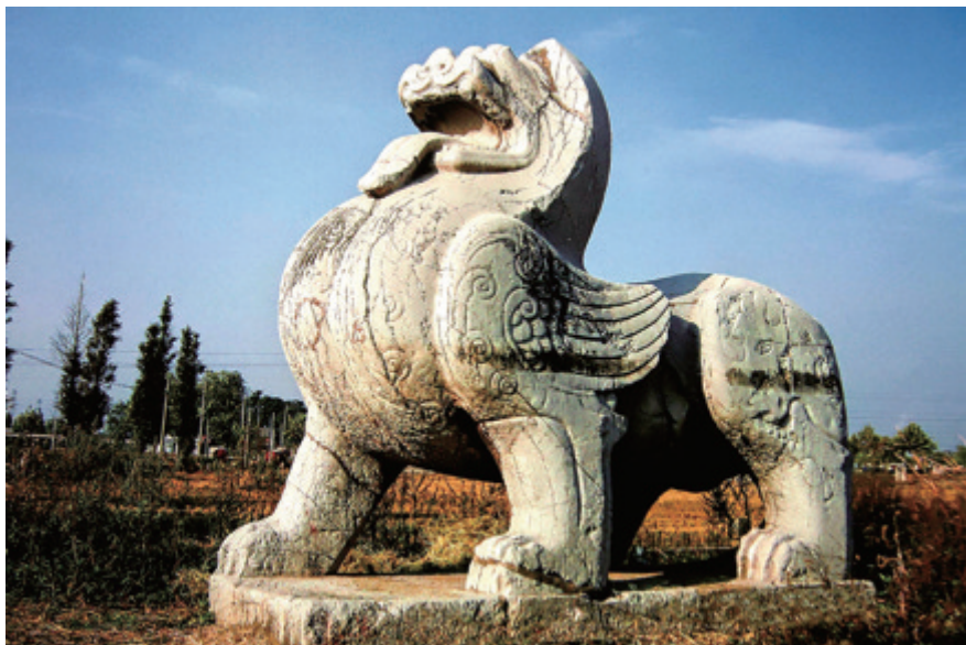
南朝梁吴平忠侯萧景墓石狮辟邪

图片资料的收录和展示是一部考古学著作的重要组成部分。安随身携带了三台相机，其中一台是专