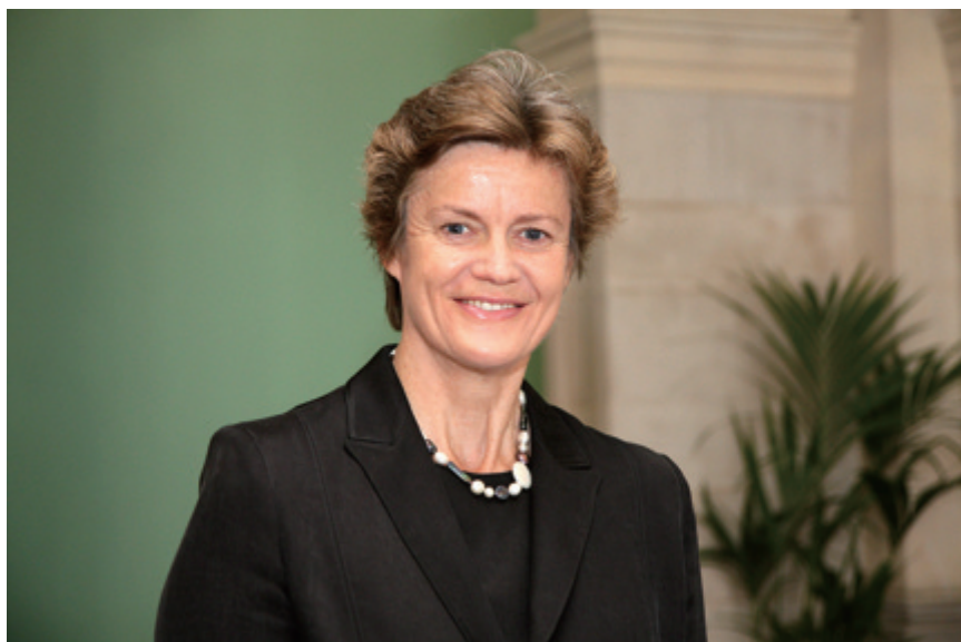
英国驻华大使吴百纳

为进一步推动中英两国经济发展，我们需要继续加深并扩大两国间的政策和商业互通，在新的领域