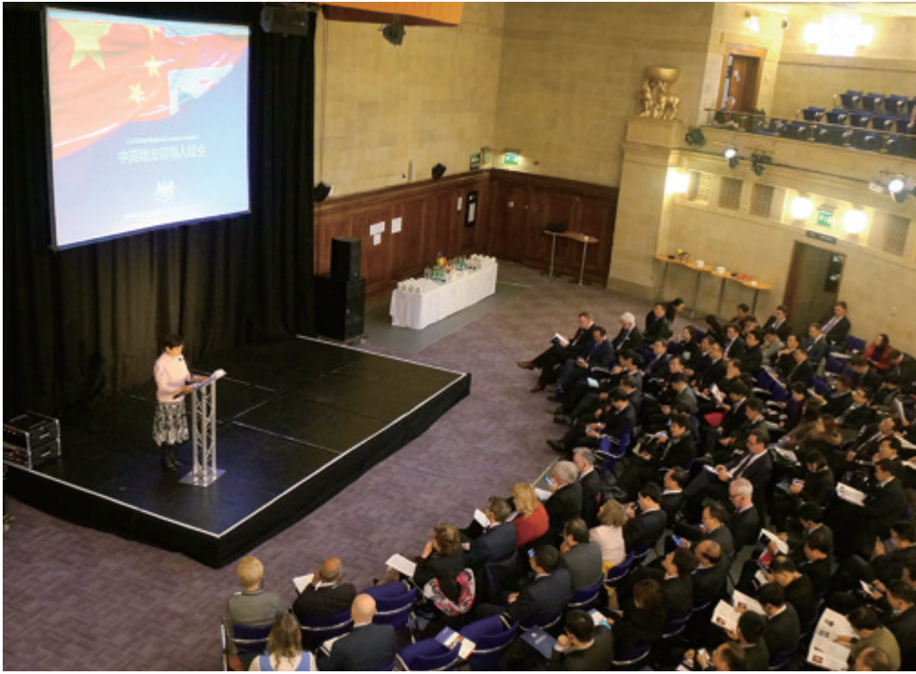
李小林会长在中英地方领导人会议开幕式上讲话