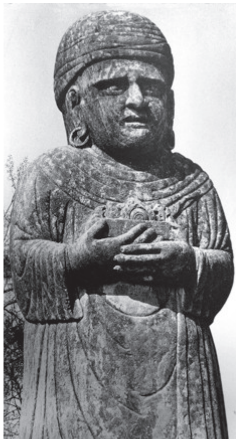
北宋永定陵阿拉伯客使雕像

安正在给一个石像服装上的雕花纹饰拍照，突然发现管理人员开始驱赶游人。问明了情况，她直接找到县领导理论道：“我十分理解您的好意，但这个公园是属于他们的，是我干扰了他们，如果不停止清场我就不参观了。”县领导被她