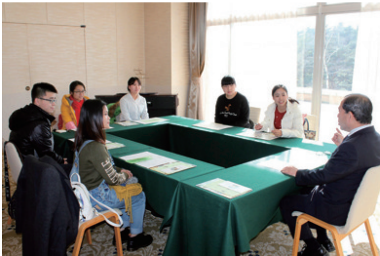
企业负责人向学生讲解企业文化

全国友协友好中心（中国对外友好合作服务中心）是全国友协的九个外事窗口之一。2006年友好中心将“暑期赴美带薪实习”项目引入国内，项目受到全国各地在校大学生的欢迎，每年有千名以上的大学生参与其中。在此基础上，友好中心依据日本法务省“特定活动告示九（实习）”这一签证种类，从2011年开始启动中国大学生赴日社