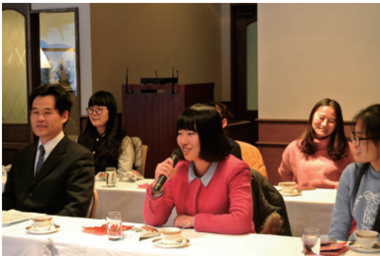
西安外国语学院的学生用日语讲述所见所感

随后，访问团访问了位于长野县信浓町的长野县斑尾东急度假村。斑尾东急度假村是长野县的代表企业之一，是一家集滑雪、温泉、购物、住宿、餐饮服务于一体的综合性度假村。来自西安、湖南、湖北的八名同学于2015年12月下旬抵达该