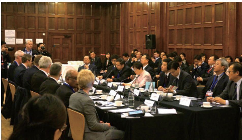
中英地方领导人圆桌会议

2016年3月21日至24日，我会与英国社区和地方政府部在英国伦敦和谢菲尔德市共同举办了主题为“长江经济带和英格兰北方经济中心合作”的首届中英地方领导人会议。会议包括中英部长级圆桌会，中英地方领导人会议开幕式、中英地方领导人圆桌会议、平行分论坛，实地参观，以及英政府高层非正式会见、英中贸易协会第四届年会开幕式等活动。