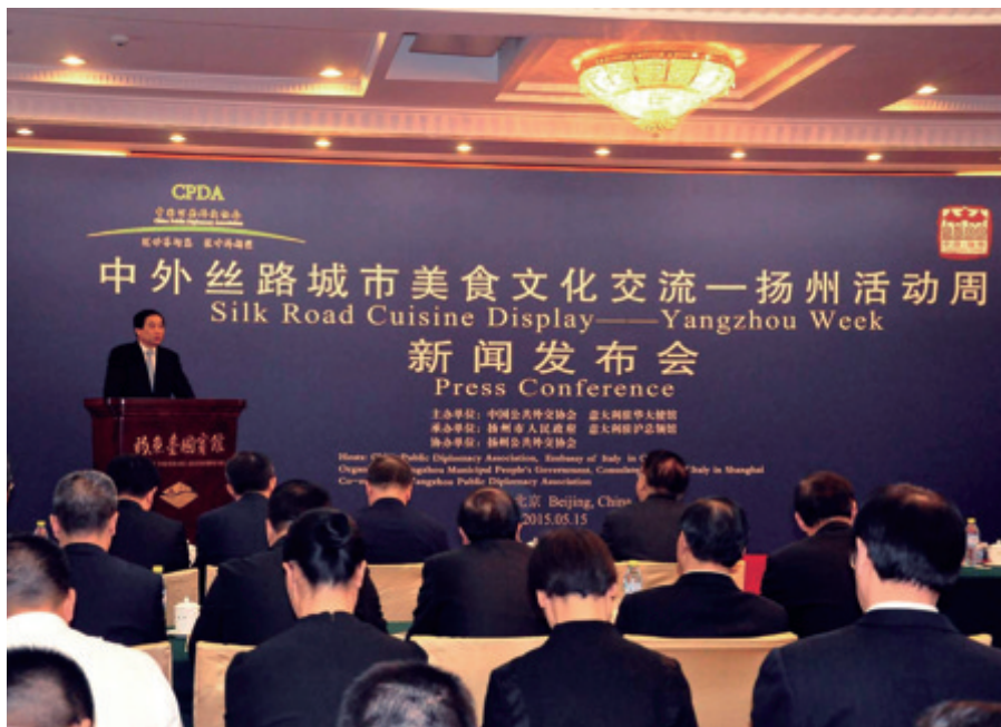
扬州市市长朱民阳在新闻发布会上致词

美食节邀请了当时我市已正式结好的美国、日本、澳大利亚等 6 个国家的 8 对友好城市的代表团以及与我市有美食文化交流的韩国、法国、德国、比利时等其它国家的友好交流代表团共 360 余名国际宾