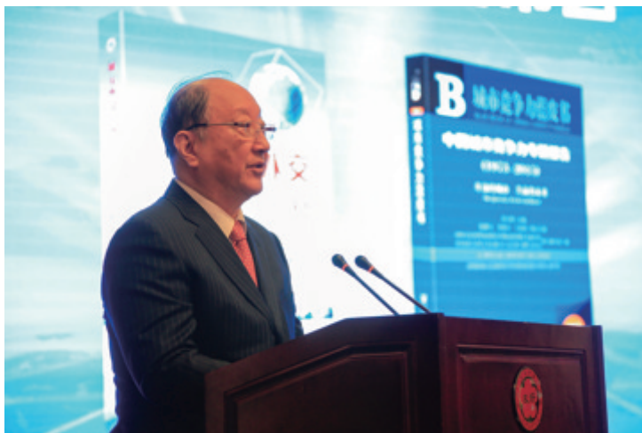
第十届全国政协副主席徐匡迪讲话