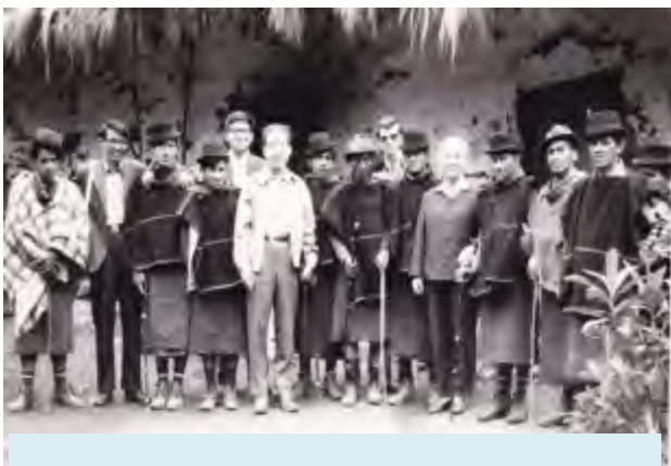
图：1979年到哥伦比亚访问的中国客人与当地印第安人合影