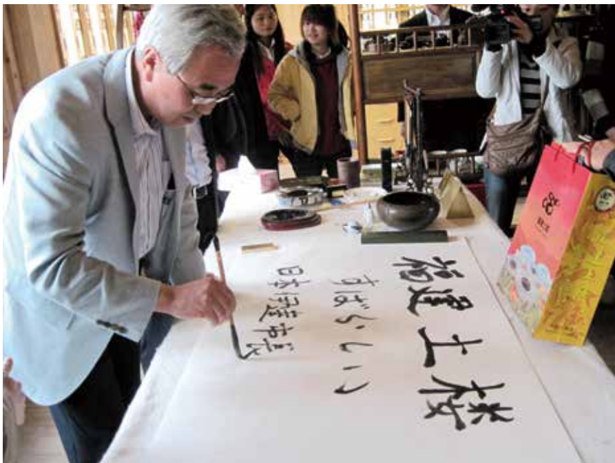
日本伊达市菊谷秀吉市长在南靖土楼题词留念‘福建土楼妙不可言’。