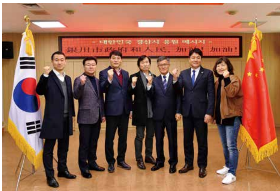
曾在银川研修的庆山公务员声援银川战胜疫情。

宁夏与庆尚北道携手抗疫的动人故事自此展开。2月5日，庆尚北道庆山市决定订购10,000支KF94口罩捐赠给其在宁夏的国际友城——