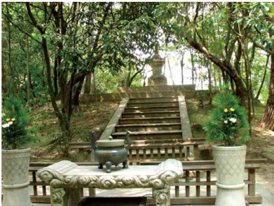
图为日本唐招提寺鉴真大师墓。

我被奈良的唐风古韵深深地迷醉了!好想有机会再来一次奈良!哦,不,奈良是百来不厌的!我愿意在我的生命里,能够一次次地、细细地、再来寻访、品味这唐风洋溢的奈良城! ■