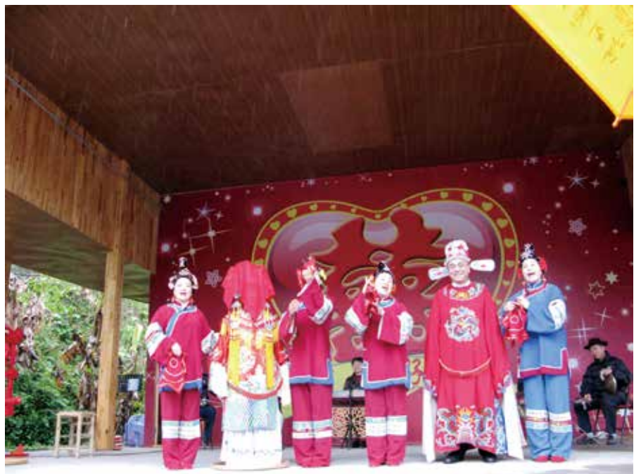
菊谷秀吉市长驻足观看剧目《喜结良缘》，被美丽的公主投中绣球，登上舞台成为漳州的‘驸马爷’。

道，描述漳州老百姓的日常生活“喝个早茶，打太极拳、晨练、骑自行车，十分健康惬意”，也向市民介绍“漳州气候温暖，适宜蔬菜等农作物和花卉生长。港口资源丰富，水产品生产、加工发达。”依托友城宣传，漳州的荔枝等特色水果走上日本餐桌。伊达市的民众对漳州人的淳朴、真诚，尤为留下深刻印象，字里行间洋溢着对漳州的亲切感。对慕名前去北海道、伊达旅游的中国朋友，他们亦是格外热情。