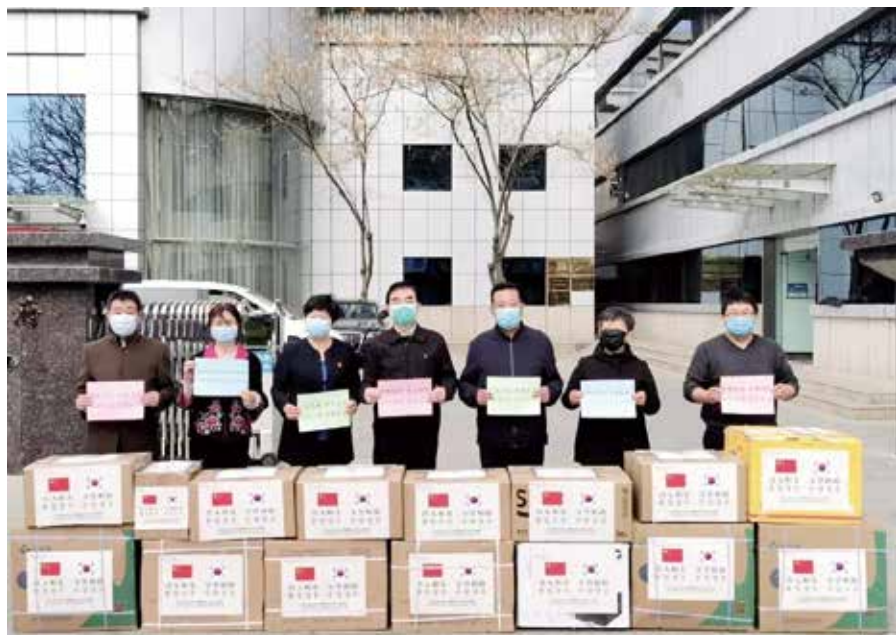
宁夏向韩国庆尚北道捐赠防疫物资。

成的，宁夏与庆尚北道早在2004年就已结缘并签订《关于建立友好交流关系协定书》。16年来，两地友好关系稳步推进，各领域交往不断密切，形成了公务员互派、青少年交流、化妆品产业等一系列品牌项目和务实合作。特别是在共同抗击疫情过程中，两地友好关系得到不断深化，友好关系更加深入人心，也为两地正式建立国际友城关系奠定了坚实基础。目前，两地正积极沟通正式结好事宜，并加强经贸、医疗、教育、投资等领域交流，推动友好关系朝着更加务实的方向发展，让友好关系的光芒早日驱散疫情阴霾，共同开启两地友好关系的美好明天。■