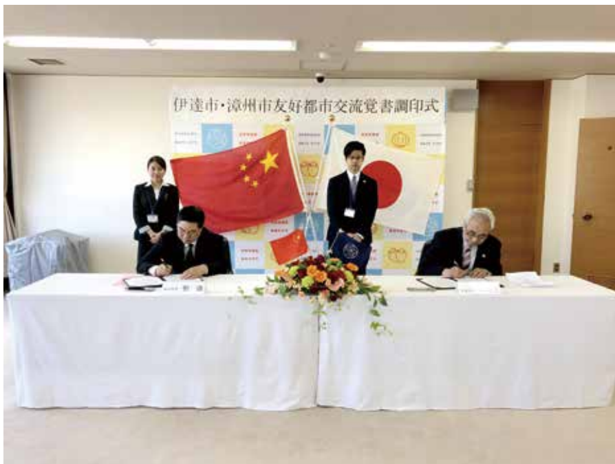
2019年5月，漳州市刘远市长率团访问伊达，与伊达市菊谷秀吉市长签署两市交流合作备忘录。

政府提出的市县主要领导加大境外招商力度的要求和我市“大抓工业、抓大工业”的部署，推动友城交流合作，刘远市长率漳州市政府代表团访问伊达市，与菊谷秀吉市长签署两市交流合作备忘录。双方达成共识，将进一步推动在经济、贸易、科技、人才教育、养老养生、旅游等方面交流合作，提升产业合作水平，拓展城市管理经验交流，密切校际交流和青少年往来，扩大新闻交流及沟通协商，促进两市共同繁荣发展。