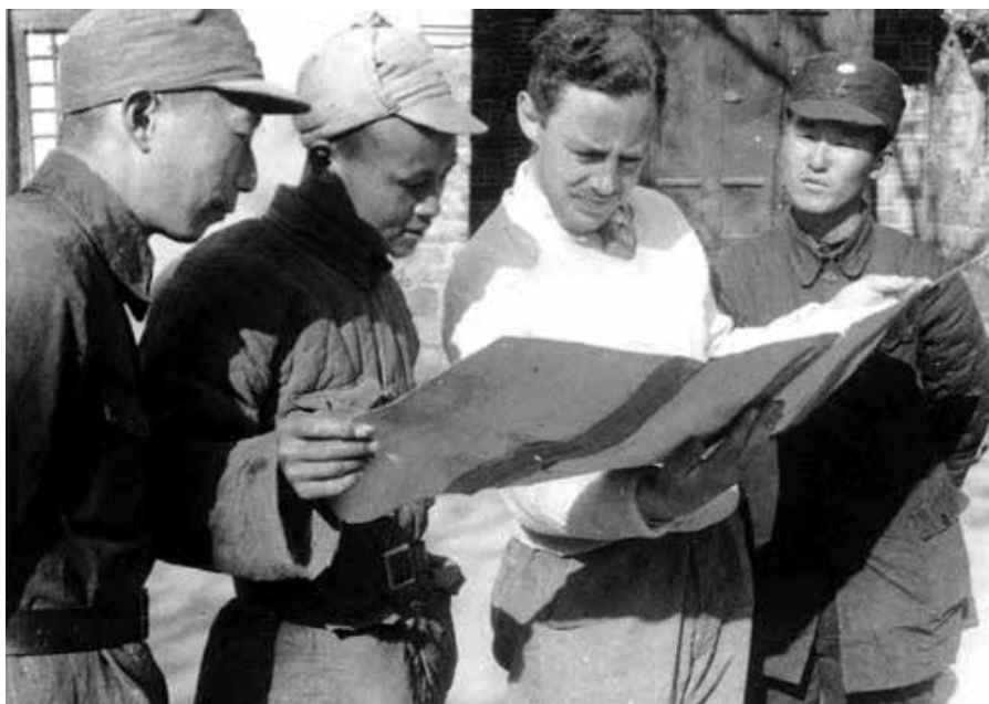
1939年5月，何克在八路军根据地，左起聂荣臻、翻译刘柯、何克、邓拓。

“学校办得很好，我们认为自己正在培养新型的孩子。现在又拨给我们一些真正关键的机器，是小型的，可用水轮带动，不过很有效，