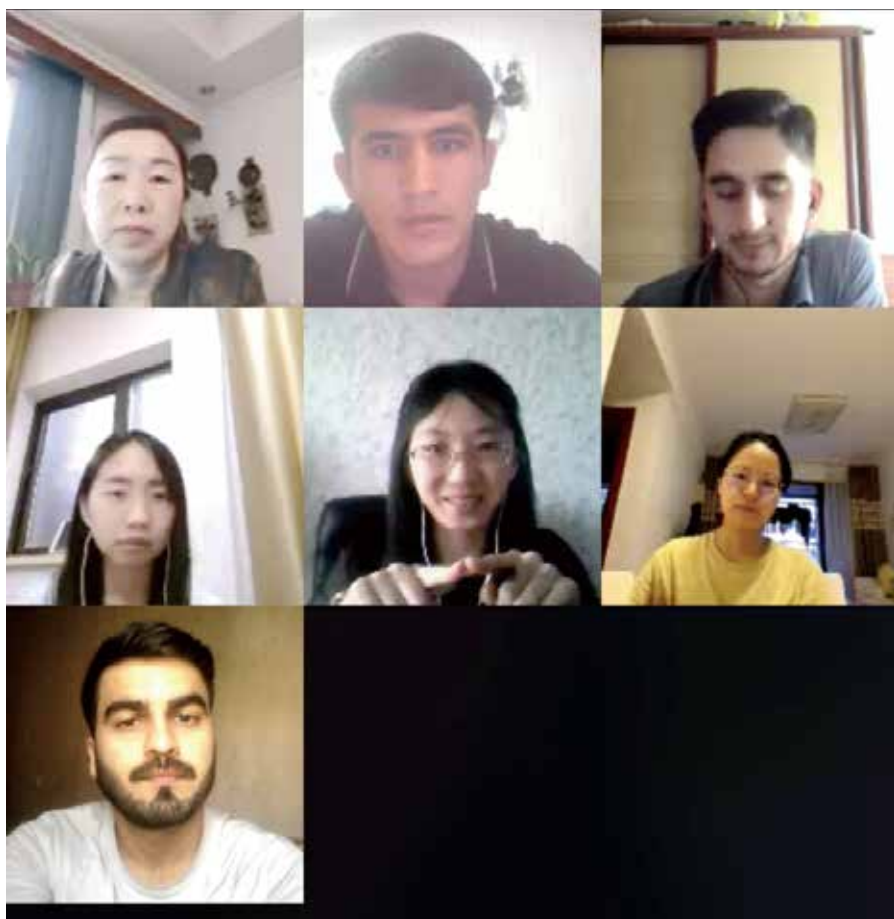
图为翻译组召开视频协调会议。

我与你未曾谋面，同样的情怀感召我们并肩前行；我与他山川异域，不同的语言难阻我们心意相通。几台普通的电脑，几本泛黄的词典，几颗热忱的初心将凡人善举的“小行动”凝集成共克时艰的“大力量”；为一方友邻筑就一道信息长城，为两国民众架起一座友谊之桥。■