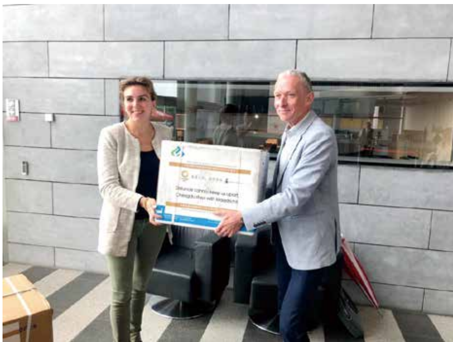
荷兰马斯特里赫特市副市长薇薇安·赫依莲（左）向该市恩威达医院董事长罗杰·陆特（右）转交捐赠物资。

成都将在全力保障班列正常运行基础上，进一步提升运力和效益，为各国携手抗击疫情，深化抗疫合作提供重要支撑；积极保障国际物流供应链，拓展与沿线国家经贸合作，为高质量共建“一带一路”作出新的贡献。■